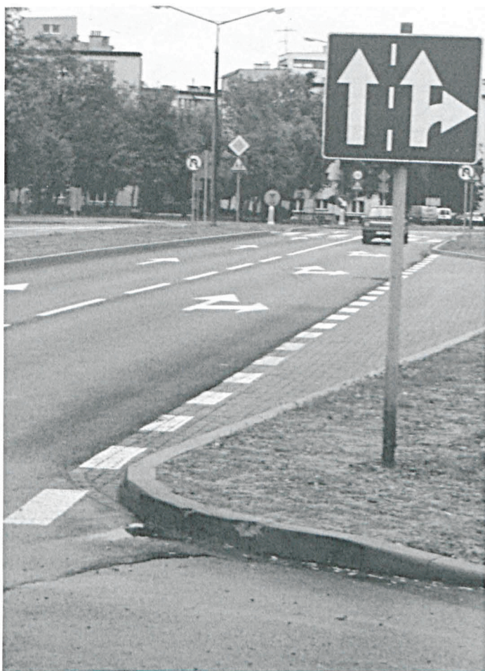
Przebudowany odcinek Al. Jana Pawła II w Parczewie

Jedną z inwestycji był pierwszy etap przebudowy drogi powiatowej nr 1635L, tj. Al. Jana Pawła II w Parczewie na odcinku od km 2+026 do km 2+515. Przebudowa tego odcinka Al. Jana Pawła II o długości 491 m. realizowana była od maja do września br. w ramach Narodowego Programu Odbudowy Dróg Lokalnych. Całkowity koszt prac wyniósł 2 259.220 z, w tym dofinansowanie wyniosło 1 126.425 zł. Powiat Parczewski wspólnie z Gminą Parczew pokrył po 50 % kosztów tj. 1 132.795 zł. W ramach tej Inwestycji ułożono nową nawierzchnię bitumiczną na obu pasach jezdni, zjazdach a także parkingu MOSiR. Wybudowane zostały nowe chodniki oraz ścieżki rowerowe z kostki brukowej. Wykonano również nowe urządzenia bezpieczeństwa ruchu w tym słupki blokujące, oznakowanie poziome i pionowe.