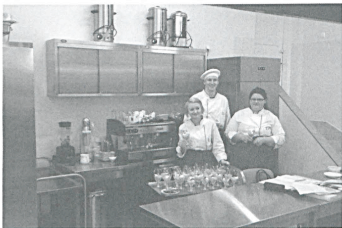
W pracowni gastronomicznej

Od kwietnia 2014 r. Zespół Szkół Ponadgimnazjalnych w Parczewie realizuje projekt „Vocational Placement. Program stażowy u pracodawców dla uczniów Zespołu Szkół Ponadgimnazjalnych im. Stanisława Staszica w Parczewie”. Projekt realizowany jest w ramach Programu Operacyjnego Kapitał Ludzki, Priorytet IX. Rozwój wykształcenia i kompetencji w regionach, Działanie 9.2 Podniesienie atrakcyjności i jakości szkolnictwa zawodowego. Projekt współfinansowany ze środków Europejskiego Funduszu Społecznego, na podstawie trójstronnej umowy pomiędzy Polskim Towarzystwem Ekonomicznym w Lublinie, Powiatem Parczewskim i Zarządem Województwa Lubelskiego.