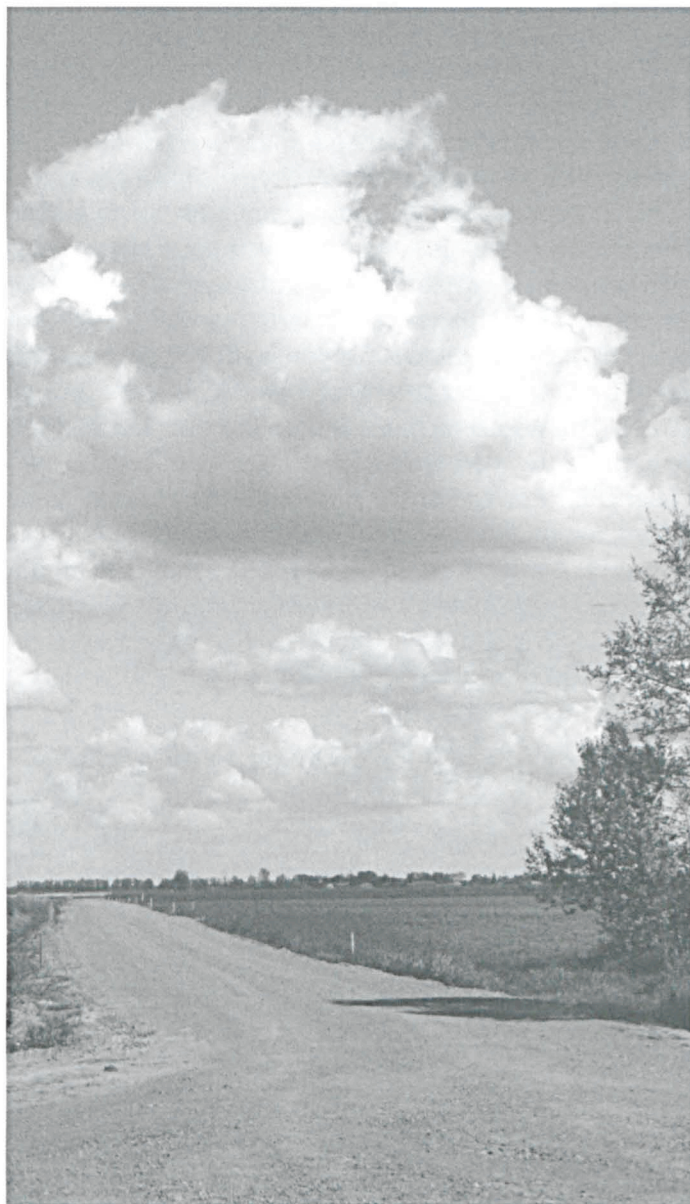
Droga gminna w Zaliszczu