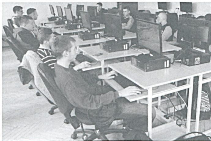
W pracowni informatycznej

Uczniowie poznają tajniki przyszłych zawodów w trzech nowo powstałych pracowniach zawodowych: samochodowej, informatycznej i pracowni gastronomicznej. W ramach projektu szkoła współpracuje z lokalnymi przedsiębiorcami, u których uczniowie odbywają staże zawodowe. Każdy z 300 uczniów z ZSP odbywając takie staże w wymiarze 150 godzin ma możliwość zdobywania wiedzy i umiejętności zawodowych w warunkach jakie czekają ich po wejściu na rynek pracy. Motywujące dla przyszłych pracowników jest otrzymywanie wynagrodzenie już podczas stażu. Materialną satysfakcję otrzymują także pracodawcy przyjmujący uczniów na staż.