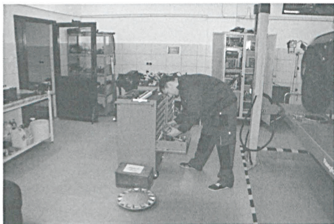
W pracowni samochodowej

W projekcie udział biorą cztery szkoły wchodzące w skład zespołu: Technikum Pojazdów Samochodowych, Technikum Żywności i Usług Gastronomicznych, Technikum Informatyczne oraz Technikum Fryzjerskie.