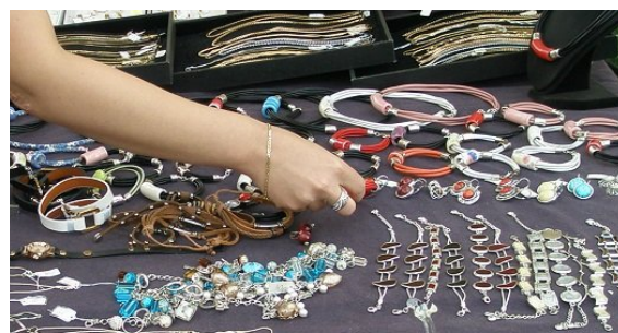
Coś dla pań. Ozdoby precudnej urody. Do nabycia. Tanio