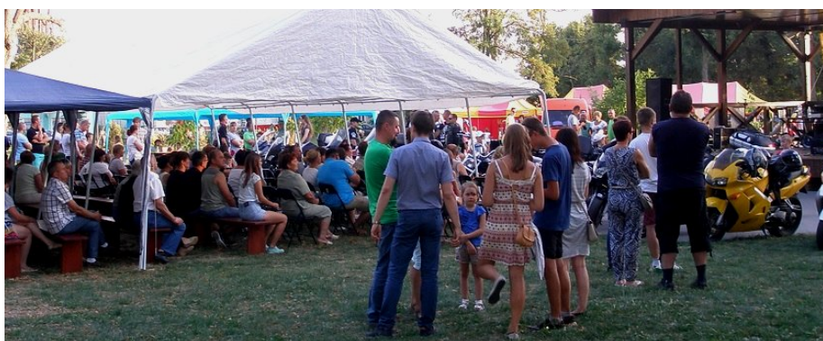
Publiczność dopisała, słońce również nie było zbyt dokuczliwe. Było radośnie