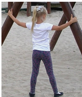
Wszystkiego było tyyyyee, że aż trudno spa pamiętać...