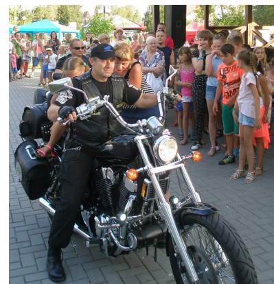
Największe wzięcie miały motory. Do przejażdżki ustawiała się kolejka