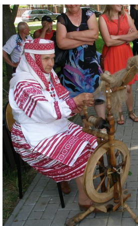
Kto dziś potrafi jeszcze tak snuć nici?