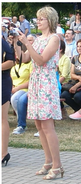
Jarmarkowe wydarzenia utrwalają wielu operatorów, a wśród nich także uroczne osoby