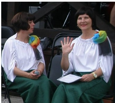
Panie z białoruskiego zespołu "Lachowickie Stroje" pozdrawiają naszych czytelników