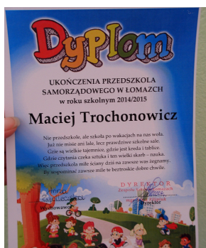
Takie oto piękne dyplomy otrzymali wszyscy absolwenci przedszkola

- Kochani rodzice. Dziękuję wam bardzo za zaangażowanie, za współpracę z przedszkolem. Byliście dużym wsparciem w naszych działaniach.