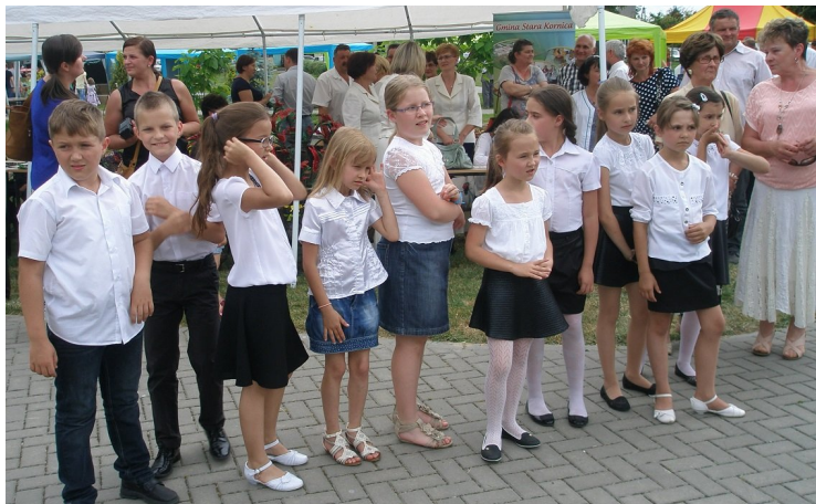
Zespół "Wiem dokąd idę" już wie, że za chwilę wychodzi na scenę