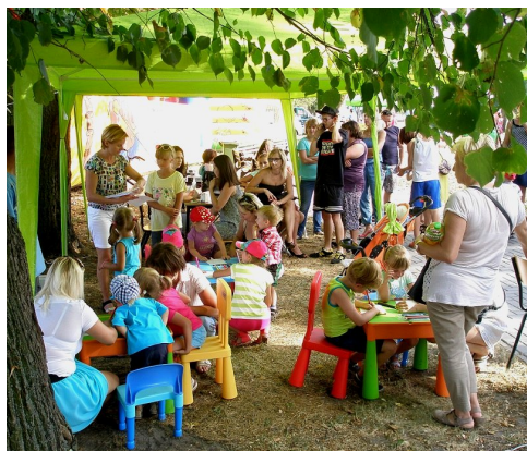
Dzieci malowały prace konkursowe, a mamy w tym czasie u kosmetyczki badały stan skóry