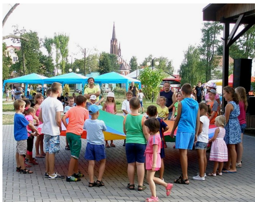
Były zabawy grupowe, było też malowanie twarzy