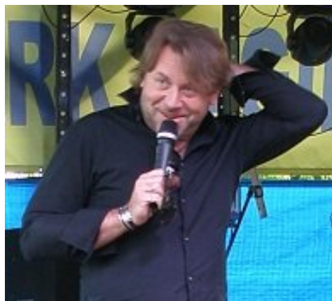
Znany z ekranu TV aktor Michał Milowicz błysnął m. in. wykonaniem kilku piosenek Elvisa Presley'a