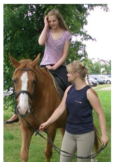
Urocz. Koń i dziewczyna...