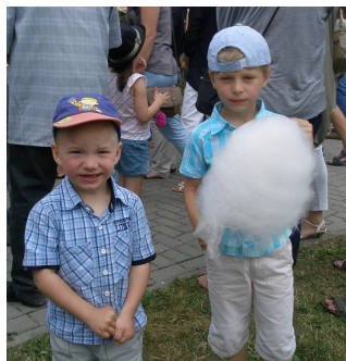
Czy wata jest z VAT-em? A co to jest ten VAT?