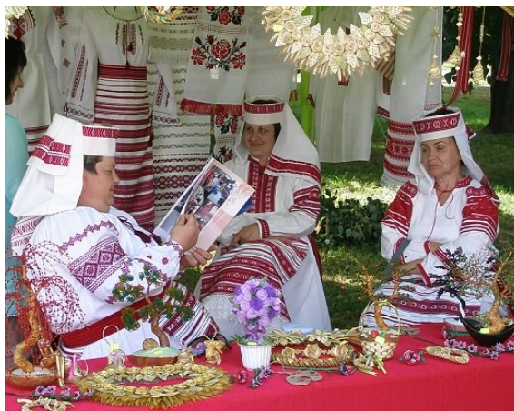
Goście z Białorusi zaprezentowali na Jarmarku nie tylko stroje ludowe, ale także ręcznie wykonane ozdoby

W parku było tego dnia, pomimo wielkiego gorąca, ludno, gwarno i wesoło.