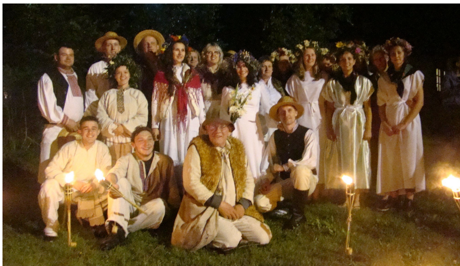
Grupa obrzędowa „Czeladońka” w świętojańskim składzie

Noc Świętojańska czyli święto obchodzone w nocy z 23 na 24 czerwca, w wigilię świętego Jana Chrzciciela, to baśniowy wieczór i noc. Któż nie zna opowieści o kwiecie paproci.