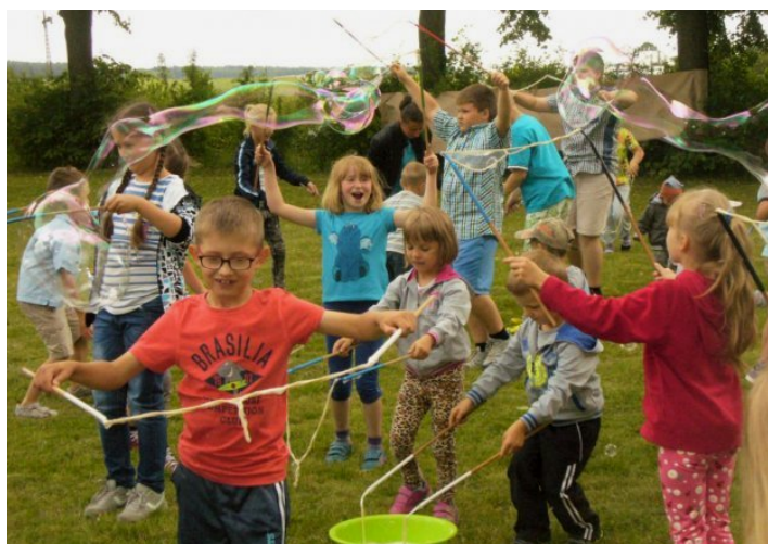
pp. Arseniukowie malowali dzieciom twarze, zapraszali także do zabawy bańkami mydlanymi

Boisko szkolne w Huszczy było miejscem pikniku rodzinnego, przygotowanego przez pedagogów z miejscowej szkoły podstawowej, a zorganizowanego 21 czerwca w ramach programu Zachowaj Trzeźwy Umysł.