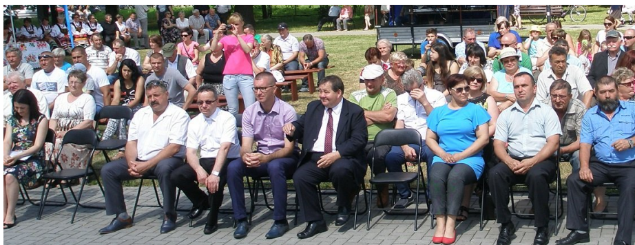
Skwar dał się tego dnia we znaki. Zbrakło zadaszni i było przymusowe "grilowanie" VIP-ów

Jako że w grodzie łomaskim szczerku broni w ostatnich czasach nie słyszano, śmiało zatem doń na tegoroczny jarmark przybywali liczni kupcy z ościennych terenów, w tym z Rusi Zabużańskiej także. Przybywszy rozstawili swe kramy w miejscowym parku, Jagiellońskim zwanym, poczem rozłożyli na stołach to, co sami wyrobili tudzież od innych kupców nabyli.