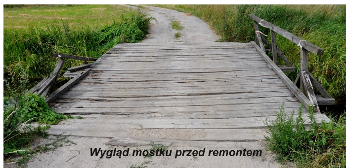
Wygląd mostku przed remontem

Prace wykonuje firma P.H.U Kolejko z Sosnowki i potrwać one do końca sierpnia. Wartość robót określono na kwotę 30 381 złotych.