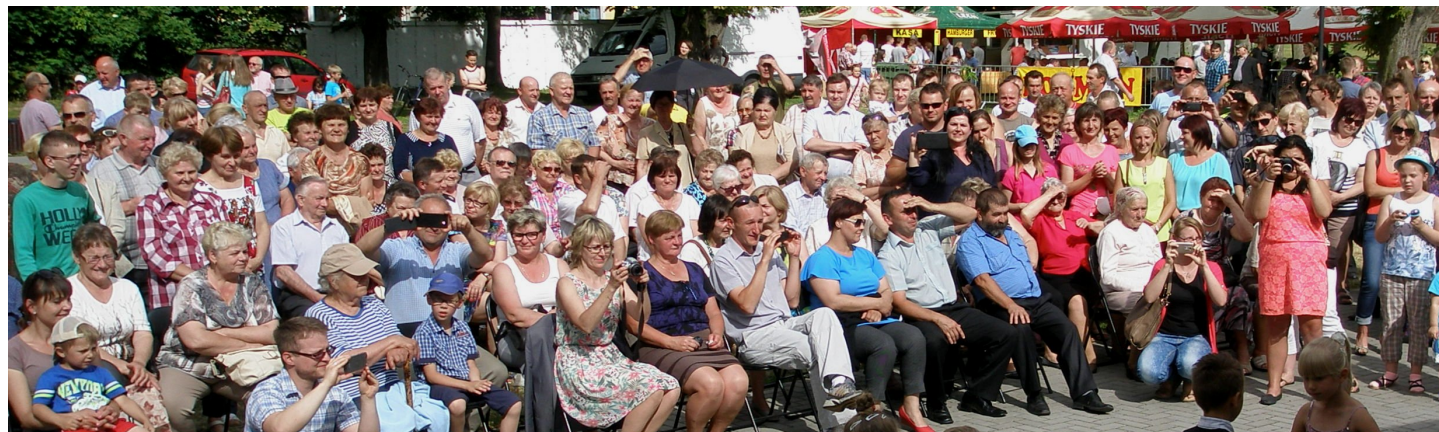
Spora część widzów wyszła z imprezy całkiem nieźle opalona, zwłaszcza na twarzy