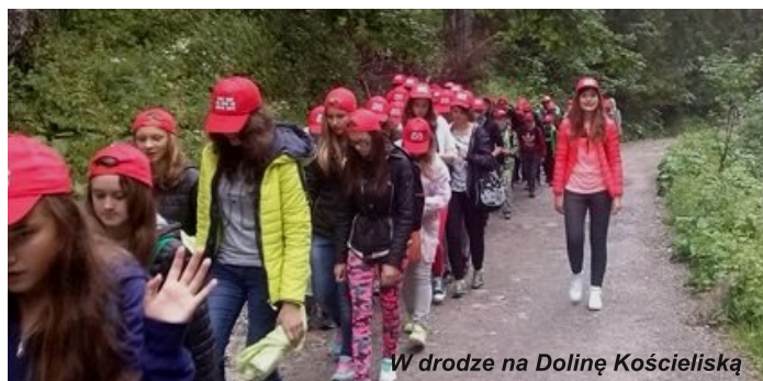
W drodze na Dolinę Kościeliską

Obszerniejsza relacja w kolejnym numerze.