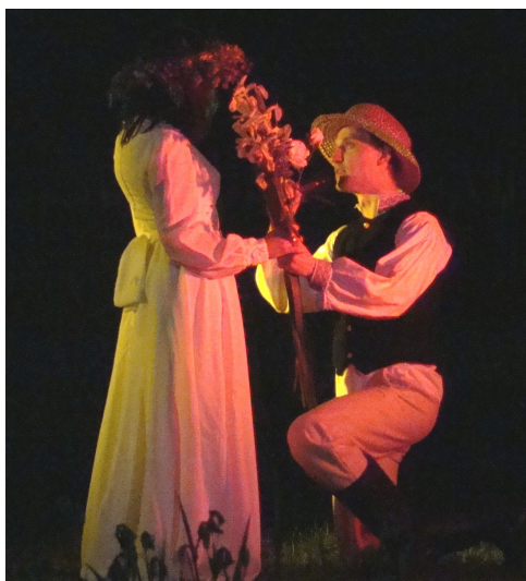
A młodzieniec ukłękłszy wręczył kwiat paproci swej ukochanej

Jeśli poszukiwać kwiatu paproci w noc świętojańską to tylko w Lubence. Nawet jeśli pogoda nie do końca jest zgodna z aktualnie panującą porą roku.