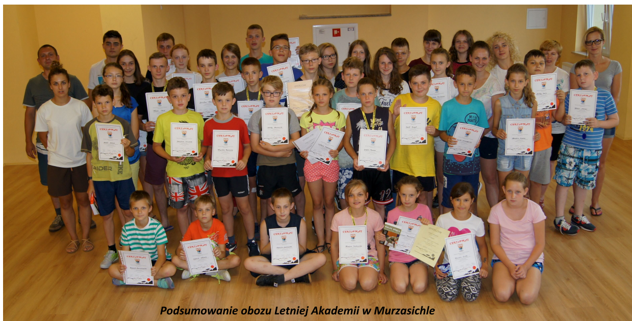
Podsumowanie obozu Letniej Akademii w Murzasichle

Wiele spraw dzieje się po raz pierwszy i jest to normalną rzeczą. Po raz pierwszy również został zorganizowany przez Akademię VIRTUS Letni Obóz Taekwon-Do. Letnia Akademia odbywała się w dniach 31 lipca do 6 sierpnia w Murzasichle, górskiej miejscowości niedaleko Zakopanego. W zgrupowaniu udział brało 45 osób, wliczając wszystkich biorących udział w zajęciach. Wszystkich, bo nie było nikogo kto nie chciałby skorzystać z bardzo różnej formy aktywnego wypoczynku, poczynając od adeptów Akademii Taekwon-Do VIRTUS w Łomazach i zawodników Radzyńskiego Sportowego Centrum Taekwon-do po naszą opiekę medyczną i na kierowcy naszego autokaru skończywszy. :-)