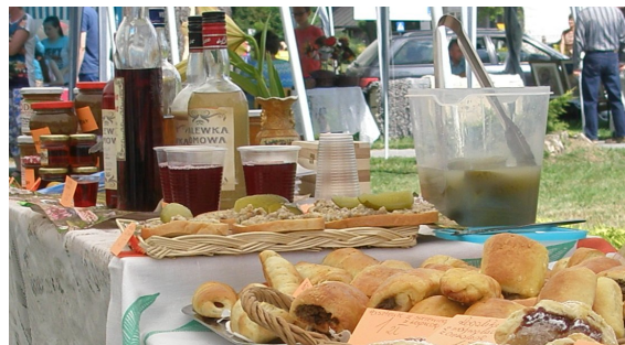
Niektórzy uważają, że dopiero jak jest co wypić i zjeść to impreza jest udana. Naprawdę?