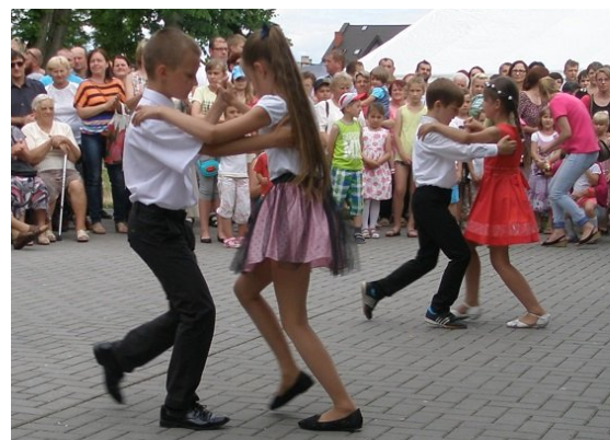
Dla adeptów szkoły tańca tańce latynoskie to łatwizna