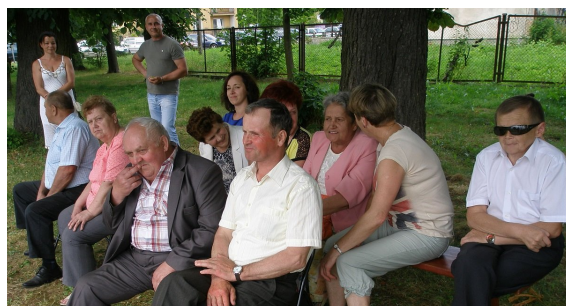
Co przezorniejsi uczestnicy imprezy skryli się przed słonecznym żarem pod kasztanami