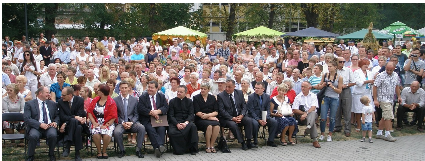
Do Parku Jagiellońskiego w Łomazach, na Dożynki Gminne, przybyło bardzo wielu mieszkańców naszej gminy. Po prezentacji miejscowości i wysłuchaniu okolicznościowych przemówień mieli oni okazję obejrzeć wiele występów odbywających się na parkowej scenie.