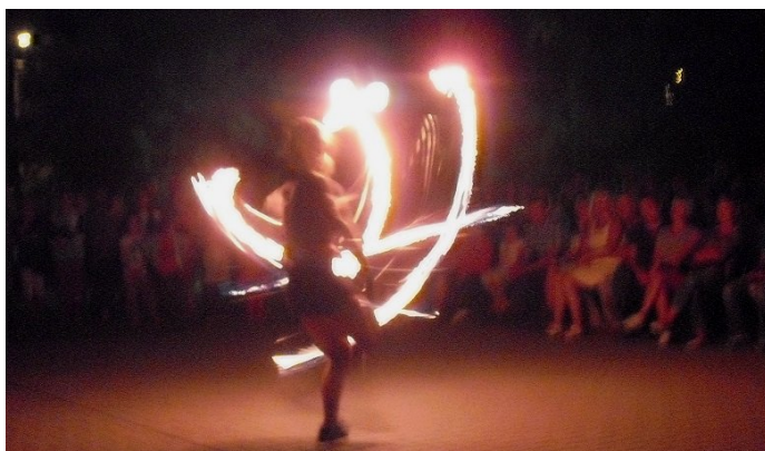
Członkinie białskiego Teatru ANTIDOTUM tańcząc malowały ogniem ulotne obrazy