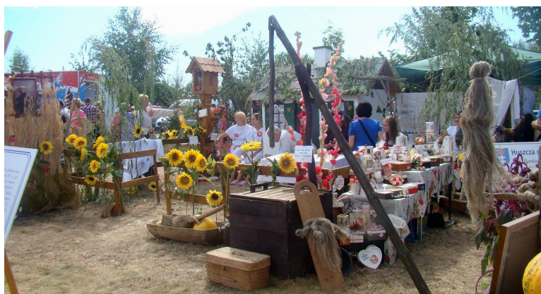
Ekspozycja promująca gminę Łomazy zyskała uznanie jury, które przyznało jej I miejsce, zaś wieniec (z Dubowa) zyskał wyróżnienie

Miejscowość Misie (gmina Międzyrzec Podlaski) była 30 sierpnia miejscem XVII Dożynek Powiatu Białskiego. Udział dość licznej reprezentacji naszej gminy był bardzo udany. W organizację i uczestnictwo zaangażowali się mieszkańcy Jusaków-Zarzeki, Dubowa, Lubenki, Studzianki, Łomaz oraz pracownicy Gminnego Ośrodka Kultury. Było zatem bardzo kolorowo, bardzo smacznie i bardzo kulturalnie. A także bogato w nagrody i wyróżnienia.