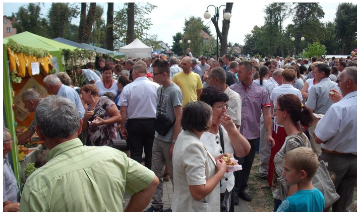
Nie potrzeba było zbyt wiele czasu, by frykasy ze stoisk przemieściły się do żołądków zgłodniałych uczestników imprezy