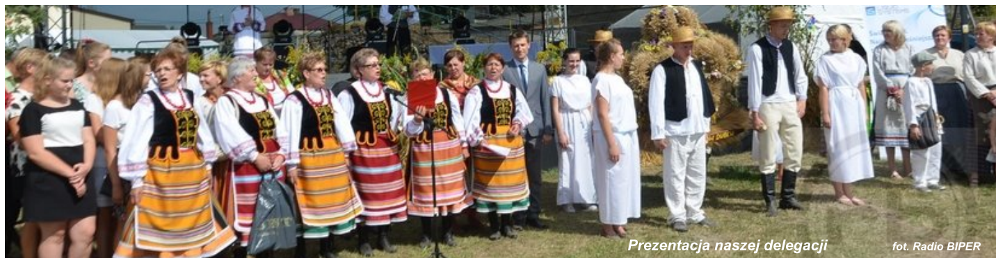
Prezentacja naszej delegacji