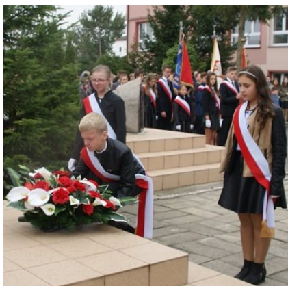
Po mszy w kościele parafialnym i przemarszu na szkolny plac złożono kwiaty pod pomnikiem Patrona szkoły

Jubileusz 100-lecia Szkoły Honorowym Patronatem objęli - Sekretarz Stanu w Ministerstwie Edukacji Narodowej, Marszałek Województwa Lubelskiego, Lubelski Kurator Oświaty, Starosta Powiatu Białskiego, Poseł na Sejm RP.