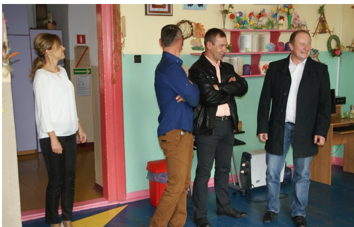
Dla absolwentów, którzy swego czasu uczęszczali do starej szkoły (czyli większość obecnych) udostępnione do zwiedzenia zostały sale w GOK i bibliotece. Pomimo zmian jakież ślady dawnych czasów pozostały