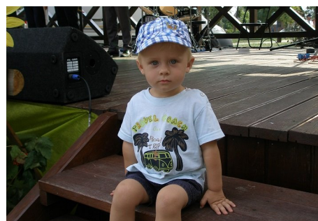
Nasz ulubiony celebryta jak zwykle na posterunku