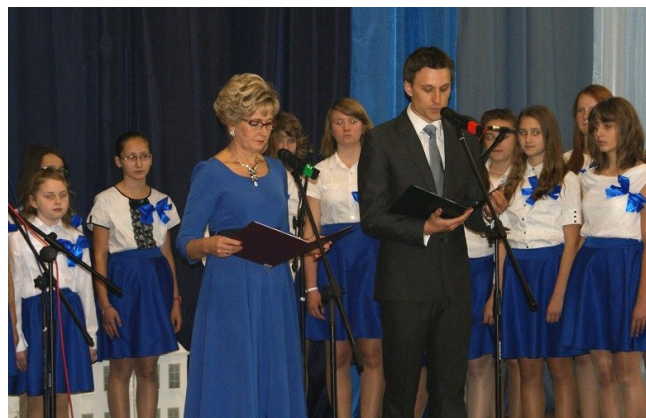
Przybyłych do hali sportowej gości powitali - Dyrektor Zespołu Szkół i Wójt, rozpoczynając tym samym część główną uroczystości. Po tej ceremonii nastąpiły przemówienia