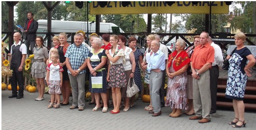
W tegorocznych dożynkach wzięły udział reprezentacje 15 sołectw naszej gminy. Z powodu szczupłości miejsca jesteśmy w stanie przedstawić tylko jedną. Cóż, delegacja Jusaków-Zarzeka zaprezentowała się pierwszy raz w historii dożynek