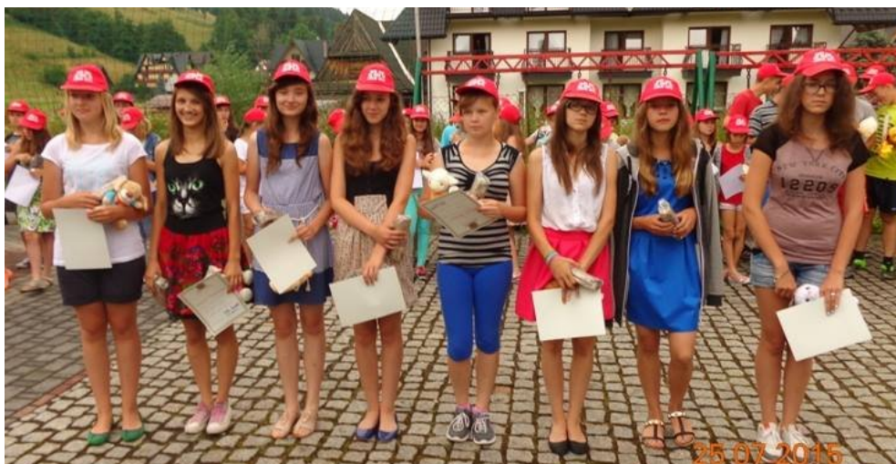
Brązowe kolonijne medalistki

W podróż po wakacyjną przygodę wyruszyliśmy o 5 rano spod remizy w Łomazach. Po kilku godzinach byliśmy już na miejscu. Zostaliśmy zakwaterowani w malowniczej miejscowości Zakopane.