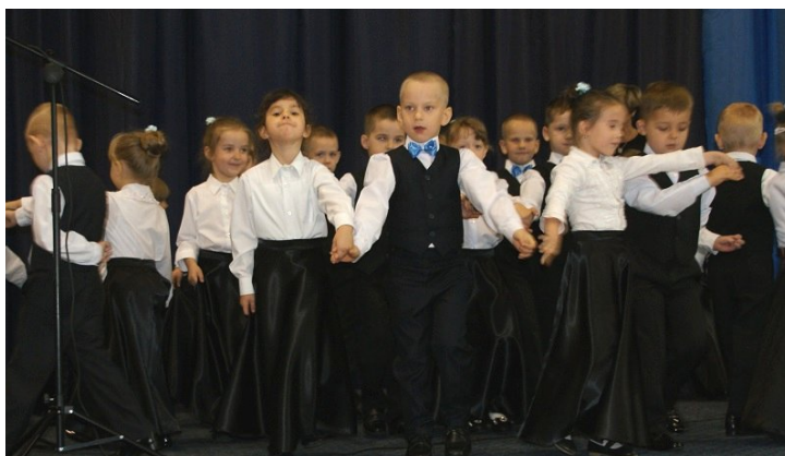
Część artystyczną zapoczątkowały łomaskie przedszkolaki, zdobywając wielki aplauz widowni za brawurowe wykonanie poloneza