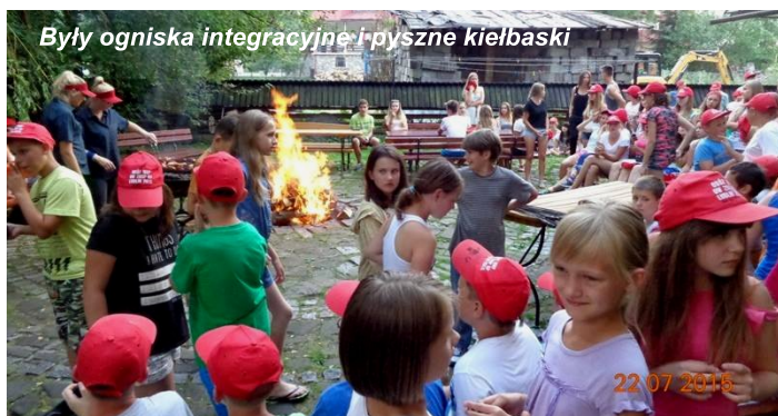
Były ogniska integracyjne i pyszne kielbaski

Nazajutrz z samego rana, razem z przewodnikiem, poszliśmy zwiedzać Dolinę Kościeliską, a celem tej wyprawy było dotarcie do schroniska. Byliśmy także w parkach wodnych: Terma Białka i Terma Bukowina, gdzie świetnie się bawiliśmy.