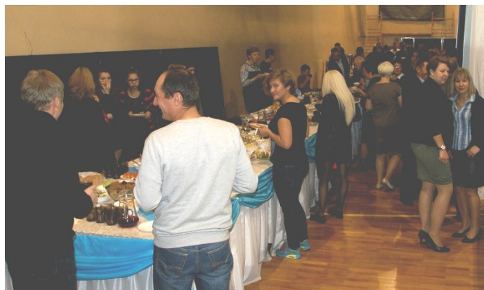
Biorący udział w uroczystościach nie mieli prawa być głodni, bowiem na zgłodniałych oczekiwał obficie zastawiony wieloma smakowitkami stół