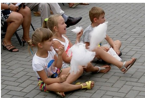
Jak to dobrze, że nie zakazali jeszcze tego na imprezach ...