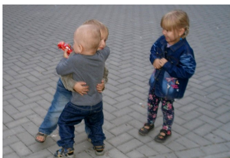
Siemasz stary! Gdzie się podziewałeś? Co to za laska?