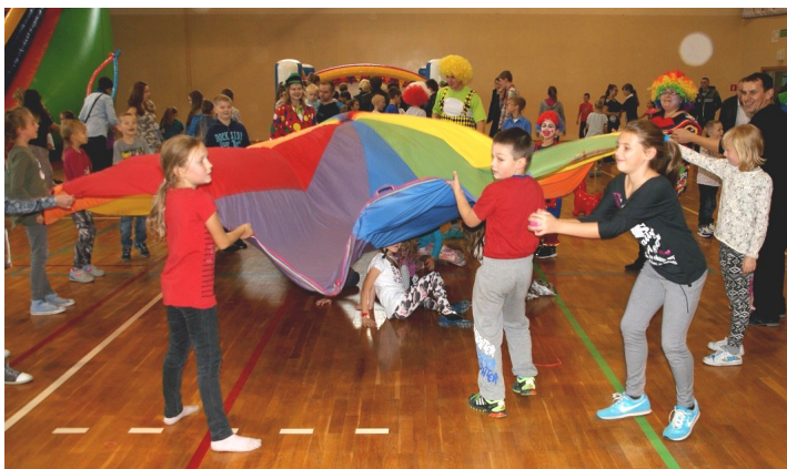
Drugiego dnia, podczas festynu rodzinnego, były prowadzone przez animatorów gry i zabawy dla dzieci, było też strzelanie z łuku oraz dmuchana zjeżdżalnia i basen z piłeczkami