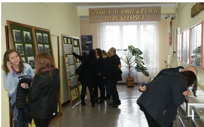
Wielkie powodzenie miała wystawa archiwalnych zdjęć. Można było odnaleźć na nich siebie w otoczeniu klasowych koleżanek i kolegów, swoje dzieci, a nawet rodziców bądź dziadków