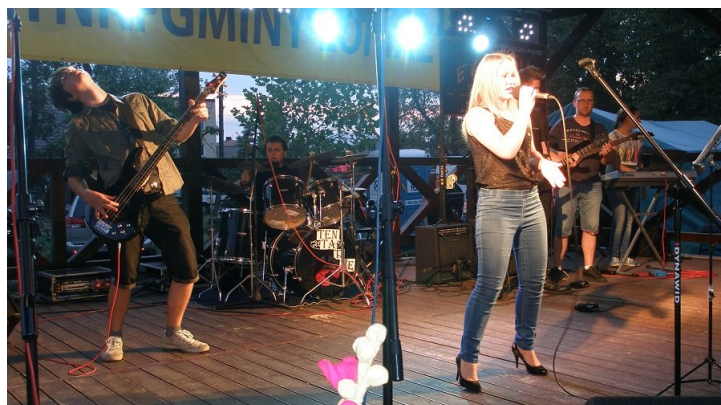
Mocniejsze granie zaprezentował na dożynkach, znany już łomaskiej publiczności, zespół TENTATIVE z Gminnego Ośrodka Kultury