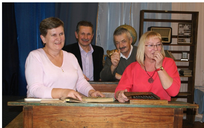
Dawne czasy można było łatwiej przypomnieć zasiadając w jednej z dwóch dawnych ławek klasowych. Nie ma jednak pewności, czy któraś z nich nie była przypadkiem tą ... ośłą