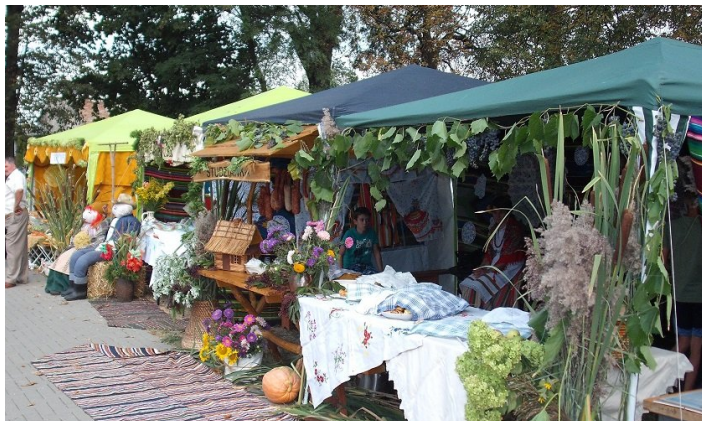
Kilkanaście stoisk, rozstawionych przy parkowych alejkach, promujących dane miejscowości, z mnóstwem przygotowanych wcześniej smakołyków, oczekiwało na hasło - JUŻ MOŻNA