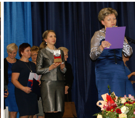
Na jubileuszowe uroczystości przybyli także przedstawiciele zaprzyjaźnionej, białoruskiej szkoły z Brześcia