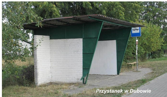
Przystanek w Dubowie

• Przeprowadzono przegląd przystanków autobusowych na terenie gminy, a jest ich łącznie 32 (kto by pomyślał).