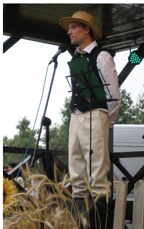
Gospodarz-Wójt wystąpił w stroju adekwatnym do rodzaju imprezy