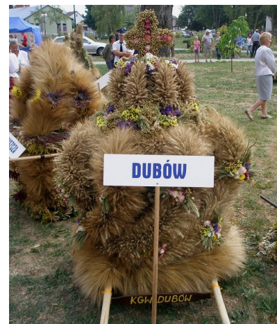
Dożynkowy wieńiec z Dubowa został mianowany delegatem naszej gminy na dożynki powiatowe