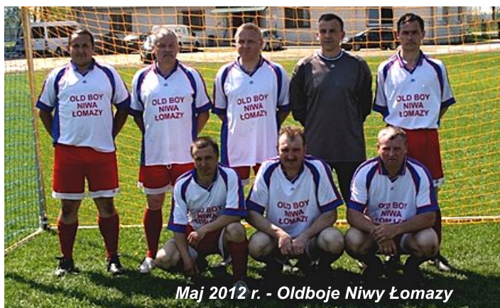
Maj 2012 r. - Oldboje Niwy Łomazy

- w pierwszej kolejności członkom Klubu, zawodnikom obecnym i tym, którzy „korki zawiesili już na kołku”, których grono liczy ponad 700 osób;