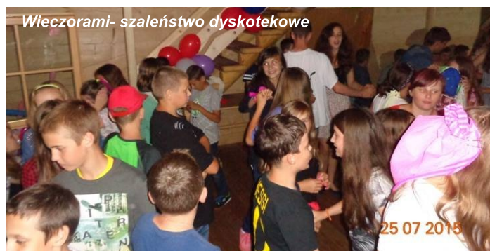
Wiezorami- szaleństwo dyskotekowe

Kilka razy chodziliśmy na sławną ulicę Zakopanego - Krupówki, co zajmowało nam 45 minut, w jedną stronę. W wolnych chwilach uczyliśmy się dwóch tańców: "Zumby" i "Belgijki". W drugim tygodniu każdy pluton prezentował swoją piosenkę kolonijną, a pewnego wieczoru cała kolonia wybrała się na długą przejażdżkę bryczkami po Zakopanem.