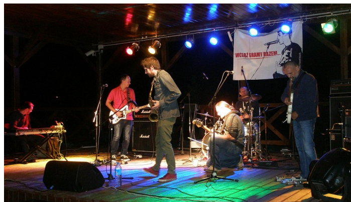
Zespół NACZYNIA na scenie w łomaskim parku

Fundacja „Białskie Horyzonty” we współpracy z GLKST „NIWA” zorganizowała w ramach X Memoriału im. Pawła Nowika koncert zespołu NACZYNIA. Ten znakomity zespół z Lublina, mający na swoim koncie koncerty w całym kraju jak i zagranicą, zaprezentował świetne, ambitne, alternatywne granie z rockowym zacięciem.