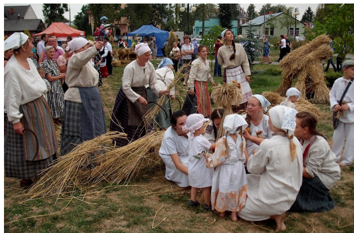
Teatr obrzędowy Czeladońka zaprezentował widowisko "Wereja", przedstawiające stary obrzęd zakończenia zbioru żyta, gdy żyło się je sierpem, później kosą