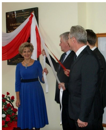
Na ścianie auli szkoły odsłonięta została okolicznościowa tablica pamiątkowa