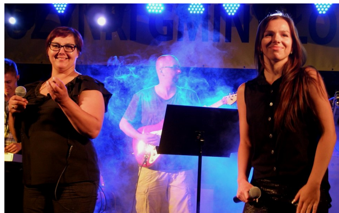
Do zabawy zapraszały dwie urocze panie z zespołu EVENTUM. Nie widać tego, ale potwierdzamy, że skutecznie