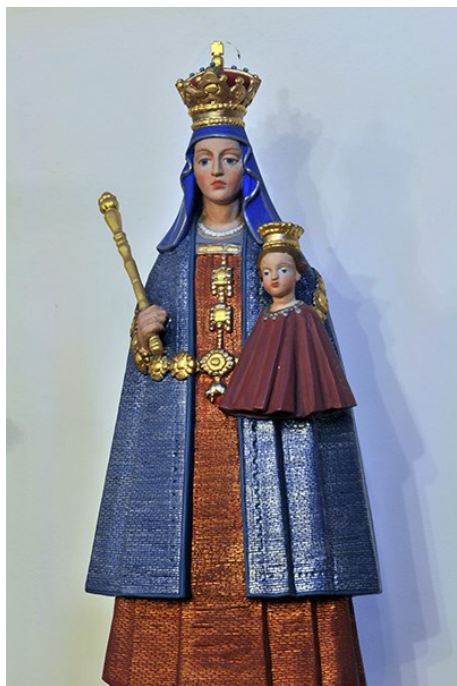
Figura Matki Bożej Kodeńskiej W Bazylice Kodeńskiej

Niemniej jednak sam wizerunek wykonany jest farbami olejnymi, które w czasach Grzegorza Wielkiego nie były jeszcze używane. O dalszych dziejach figury i drugim tytule przypisanym do Obrazu Matki Bożej w Kodniu - w następnym wydaniu Biuletynu Sanktuarium.