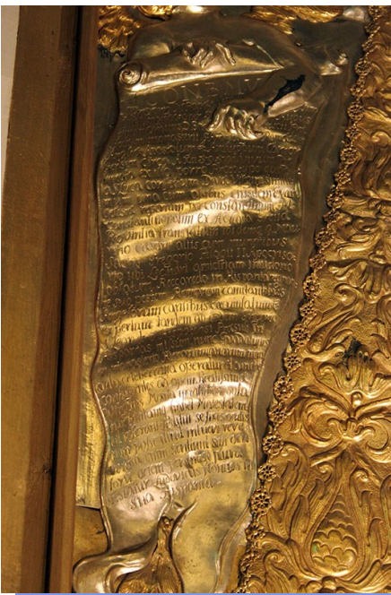
Lewa srebrna szarfa

„Kaplica Matki Boskiej cudownej. W ołtarzu suknia Matki Boskiej i Pana Jezusa srebrna pozłacana, reszta obrazu srebrną blachą okryta, złocona miejscami. Na głowie Najświętszej P. korona srebrna pozłacana i 18 kamieniami ozdobiona. Na wierzchu korony dwa krzyżyki diamentowe, a nad koroną kształt relikwiarzyka, w którym mniejszych kamieni 8, a na środku jeden większy. Na głowie Dzieciątka Jezus korona srebrna pozłacana, z 7-u kamieniami. W ręku Najświętszej Panny berło srebrne pozłacane, wysadzone kamieniami. Nad berłem jest słońce srebrne pozłacane, mające kamieni 49; pośrodku takowych ogromny rubin, dar króla Jana Kazimierza. Z drugiej strony księżyc srebrny pozłacany, mający 20 kamieni. W około twarzy Matki Boskiej jest welum z pereł zrobione, a przy welum łańcuszek szczerozłoty. Przy uszach szczerozłote zausznicie rubinami sadzone. Na szyi pereł sznurków 9, z krzyżykiem diamentowym, przy którym także pereł 8 i sztuczka o 9-u rubinach i 16-u perełkach. Pod szyją, czyli pod sznurkami pereł, klamerka srebrna pozłacana, w której 7 kamieni. Pod tą klamerką wisiła sztuczka rubinowa z dwoma koroneczkami w różę i serce formowana. Na końcu jej wisił konik rubinowy, białoszmelcowany, pod którym pierścionek złoty, a pod nim obrazek św. Jana Nepomucena, czeskimi kamieniami wysadzany. Na szyi u Dzieciątka Jezus pereł sznurków pojedynczych 2, a trzeci sznurek z kamieni. Pod perełkami zapinka srebrna pozłacana, 5-ma kamyczkami wysadzana, przy niej zaś serduszko szczerozłote.