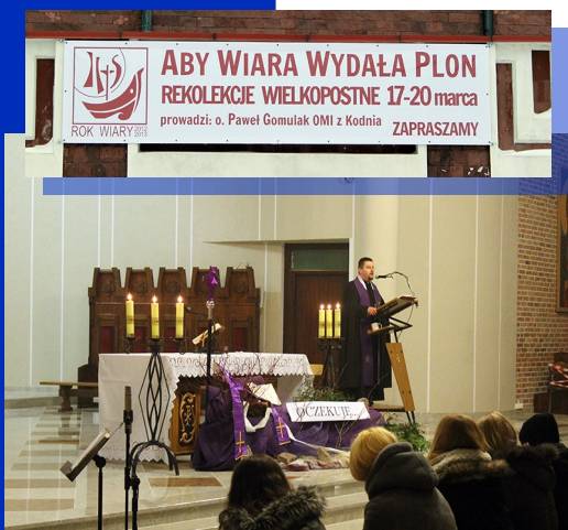
Rekolekcje wielkopostne w parafii pw. św. Kazimierza w Białymstoku

Obłacka posługa Słowa charakteryzuje się prostym przekazem, który ma być zrozumiały dla słuchaczy.