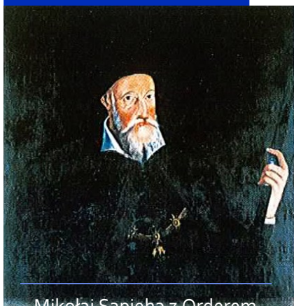
Mikołaj Sapieha z Orderem Złotego Runa Genealogia kodeńska