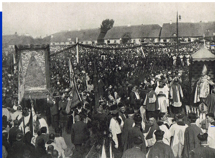
Uroczysty powrót obrazu Matki Bożej w srebrnej sukience do Kodnia. 1927 rok