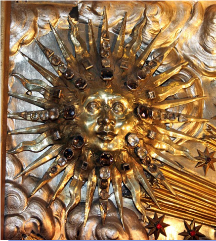
Słońce—element dekoracyjny podarowany przez Mikołaja Piusa Sapiechę