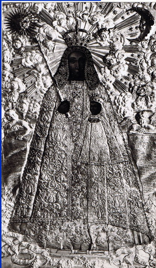
Matka Boża Kodeńska w srebrnej sukni (zdjęcie z 1931 roku)

Pierwsza wzmianka o kradzieży obrazu i karach kościelnych nałożonych na Mikołaja Sapiechę znajduje się na srebrnych szarfach ufundowanych przez Kazimierza Władysława Sapiechę już około 1690 roku, a więc zaledwie w niecałe 50 lat po wydarzeniach historycznych