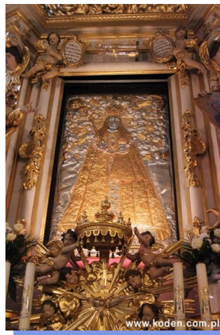
Galeria zdjęć O zabytkowej sukience