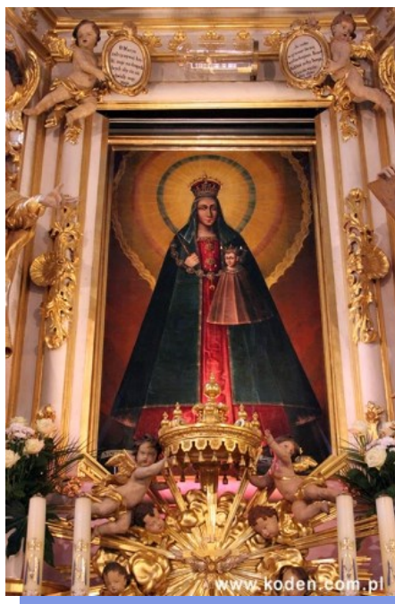
Obraz Matki Bożej i odrestaurowana zasłona umieszczone w kasecie zabezpieczającej

Obraz Matki Bożej Kodeńskiej jest trzecim w historii Polski koronowanym koronami papieskimi wizerunkiem – po Madonnie Jasnogórskiej i Trockiej. Miało to miejsce 15 sierpnia 1723 roku. Historia przybycia Matki Bożej Gregoriańskiej (Guadalupeńskiej) do Kodnia wiąże się z bezprecedensowym czynem Mikołaja Piusa Sapiehy, który w XVII wieku wykradł malowidło z papieskiej kaplicy na Watykanie. Podczas zaboru rosyjskiego wizerunek przebywał przez 52. lata na Jasnej Górze, a jego tryumfalny powrót w roku 1927 zgromadził tłumy wiernych, w tym potomka Sapiehów kodeńskich – kard. Adama Sapiehę. Od tego czasu nad sanktuarium sprawują pieczę Misjonarze Oblaci Maryi Niepokalanej. Kodeński Wizerunek Królowej Podlasia nosi również tytuł Matki Jedności. Tytuł ten nadał mu kard. Karol Wojtyła, który również gościł w Kodniu.