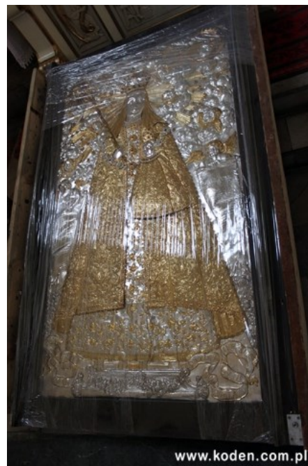
Odrestaurowana zasłona z zawieszoną repliką Orderu Złotego Runa