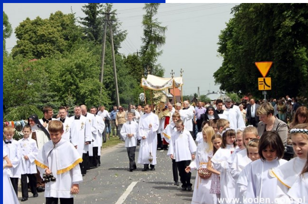
Procesja eucharystyczna ulicami Kodnia