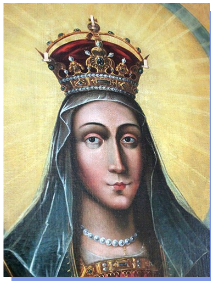
Obraz Matki Bożej Kodeńskiej po oczyszczeniu i renowacji płótna

Miesiąc czerwiec jest poświęcony Najświętszemu Sercu Jezusa. Któż z ludzi mógłby być bardziej wyczulony na pragnienia Serca Zbawiciela niż Jego Matka? Maryja nigdy nie zatrzymuje naszego wzroku na sobie, lecz konsekwentnie powtarza nam słowa z Kany Galilejskiej: Uczyńcie wszystko, cokolwiek wam powie.