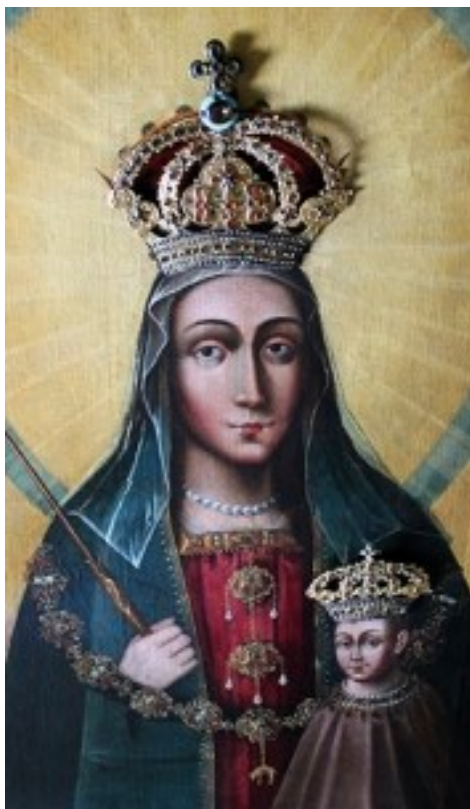
Korony papieskie z 1723 roku

kasety, w której znalazł się obraz, dokonano oględzin konserwatorskich samego malowidła. Jest ono w dobrym stanie i wymagało jedynie drobnych zabiegów oczyszczających z zalegającego kurzu oraz nałożenia świeżego werniksu. Oczyszczono również korony – dar diecezji siedleckiej z okazji jubileuszu roku 2000.