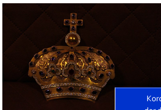
Korona Matki Bożej - dar diecezji siedleckiej