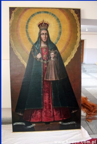
Oczyszczony z kurzu wizerunek Matki Bożej Kodeńskiej

zawarła Zofia Kossak w powieści „Błogosławiona wina”. Niestety znaczna większość wotów złożonych na zasłonie, zaginęła – najprawdopodobniej w okresie zagarnięcia kościoła infułackiego w Kodniu na cerkiew prawosławną. Niektóre elementy zostały odtworzone – jak chociażby Order Złotego Runa, który na obrazie Matki Bożej został prawdopodobnie domalowany, ale znajdował się na zasłonie.