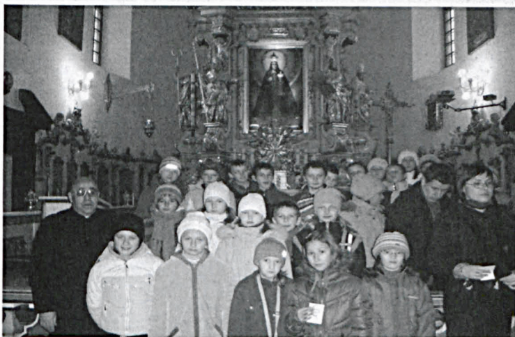
Wizyta w Kodniu