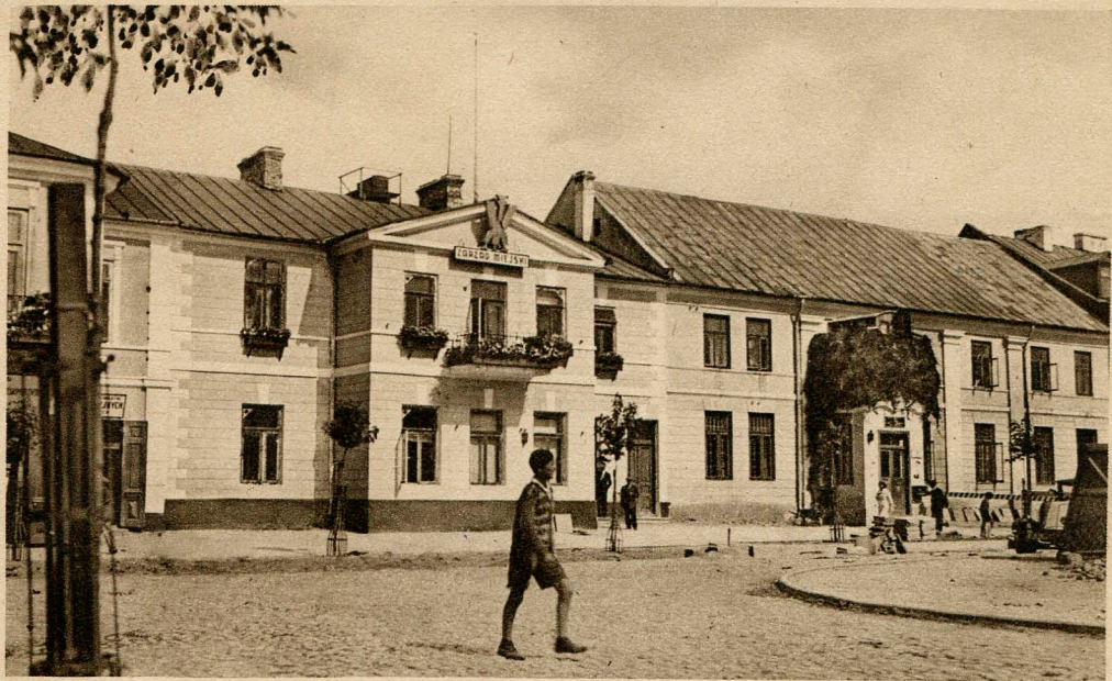
Biała Podlaska. Zarząd Miejski i Poczta