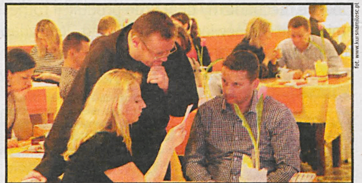
Rekolekcje warsztatowe dla par już niebawem w Białej Podlaskiej.

Fundacja Kurs na Miłość zaprasza pary małżeńskie na rekolekcje warsztatowe „Jak okazywać żonie miłość, aby czuła się kochana?”