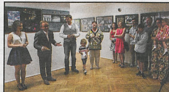
VIII Dorocznej Wystawie Fotoklubu Podlaskiego towarzyszyła autorska wystawa Angeliki Żeleźnickiej p.t. „Serce na dłoni, a dłoń na aparacie”

– Najbardziej lubię fotografować ludzi. Staram się, aby z osobą którą fotografuję, nawiązać więź, nić porozumienia. Wówczas można uchwycić charakter tej osoby, uchwycić niepowtarzalny nastrój chwili – mówi Angelika Żeleźnicka, zapewniając, że patrzy na świat wyjątkowo wnikliwie; analizuje to, co widzi, dzięki czemu dostrzega znacznie więcej niż inni. Angażuje się emocjonalnie w to co robi. Zawsze zanim weźmie aparat do ręki – otwiera serce. Szanuje wszystkich, którzy zezwalają, by uwiecznić ich na zdjęciach. Poszukuje w ludziach dobra, piękna, niepo-