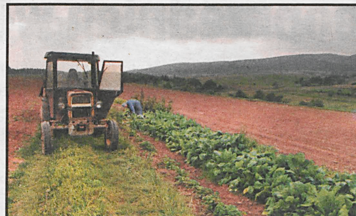
Zdaniem specjalistów sytuacja polskiej wsi jest trudna z powodu lat politycznych zaniechań. Jednak teraz ma to też związek z trendem ogólnoswiatowym