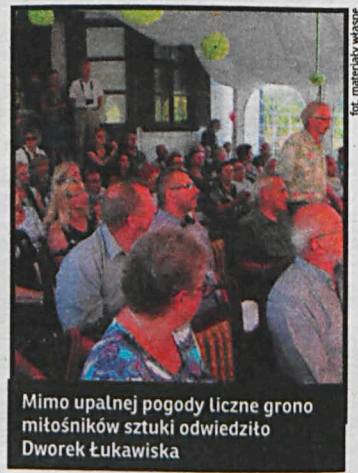
Mimo upalnej pogody liczne grono miłośników sztuki odwiedziło Dworek Łukawiska