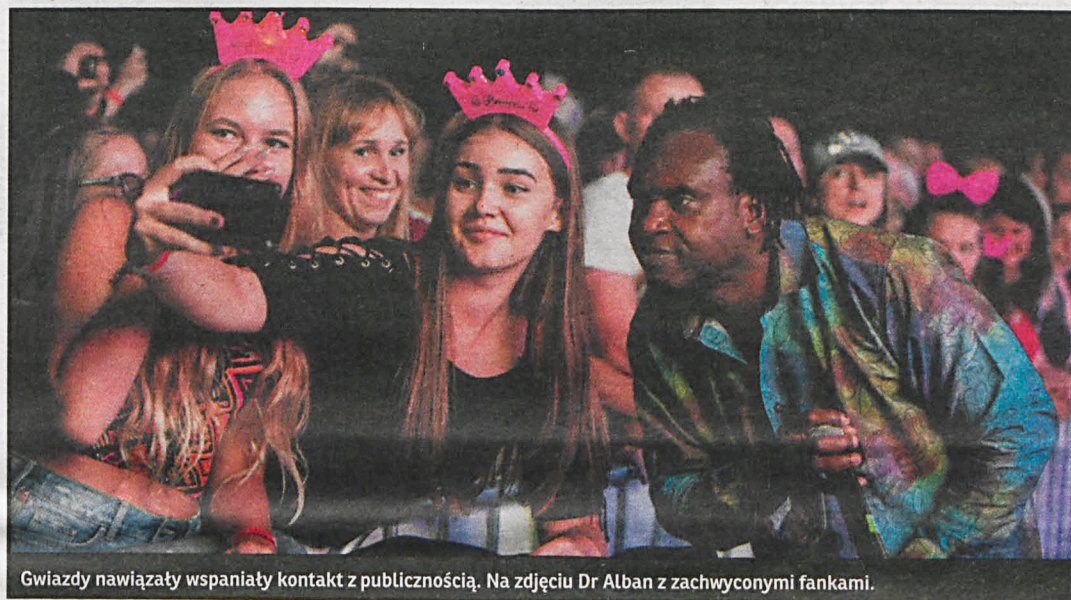
Gwiazdy nawiązały wspaniały kontakt z publicznością. Na zdjęciu Dr Alban z zachwyconymi fankami.

W ostatnią sobotę lata nie tylko białczanie bawili się w rytmach muzyki z lat dziewięćdziesiątych. Na lotnisku wystąpili artyści z Niemiec, Szwecji i Polski, m.in. Dr Alban, Fun Factory i Stachursky. Po koncercie afterparty w klubie Gramofon trwało aż do białego rana. Dla znaczącej części publiczności udział w 90' Festival on Tour stanowił sentymentalną podróż do lat wczesnej młodości, kiedy ich idole którzy zaprezentowali się w Białej Podlaskiej święcili największe sukcesy.