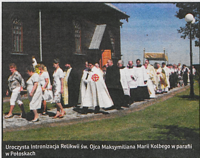
Uroczysta Intronizacja Relikwii św. Ojca Maksymiliana Marii Kolbego w parafii w Połoskach