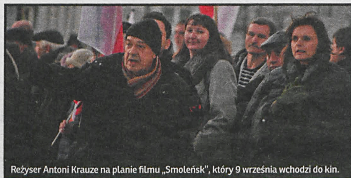
Reżyser Antoni Krauze na planie filmu „Smoleńsk”, który 9 września wchodzi do kin.

Na 9 września zaplanowano premierę filmu „Smoleńsk” w reżyserii Antoniego Krauzego. Poświęcony smoleńskiej katastrofie obraz zostanie zaprezentowany także podczas 41. Festiwalu Filmowego w Gdyni.