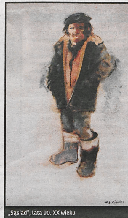
„Sąsiad”, lata 90. XX wieku

– Jednak nie cieszą mnie już tak jak niegdyś – mówi z zadumą. – Każdy obraz jest swoistym opowiadaniem, tworzonym za pośrednictwem kolorów. Z czasem zaś tych opowieści układających się w całość jest coraz mniej. Jedne zostały sprzedane, inne ofiarowane i zawsze czegoś brakuje.