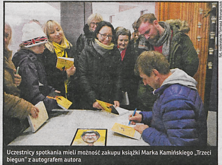
Uczestnicy spotkania mieli możliwość zakupu książki Marka Kamińskiego „Trzeci biegun” z autografem autora

Zainteresowanie spotkaniem z podróżnikiem Markiem Kamińskim przeszło najśmielsze oczekiwania organizatorów. Do Sanktuarium MBNP przybyło tak wiele osób, że trzeba było zmieniać miejsce spotkania: z przytulnej sali konferencyjnej na kilka razy większe pomieszczenie dolnego kościoła, które i tak radzynie wypełnił po brzegi. Rozmowę z podróżnikiem poprzedziła projekcja filmu „Pielgrzym”, opowiadająca o jego pieszej pielgrzymce z Królewca do Santiago de Compostela (4 tys. km): od grobu filozofa Immanuela Kanta do grobu św. Jakuba Apostoła, którą Marek Kamiński nazwał drogą od bieguna rozumu do bieguna wiary. – Nadszedł czas, by porzucić dom i wyjść na poszukiwanie Boga. Jest to wewnętrzny głos, na który nie mam żadnego wpływu – stwierdził podróżnik na początku filmu. – Taką drogę wybrałem i nią idę. Życie jest podróżą. Wędrowka po Europie nie wymaga szczególnych przygotowań logistycznych, w przeciwieństwie do wypraw na biegun. Droga sama prowadzi – jest oznaczona, co kilka kilometrów jest możliwość przenocowania, zaopatrzenia – wyjaśniał podróżnik zachę-