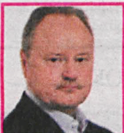
JANUSZ SZCWARCZAK Posł PIS