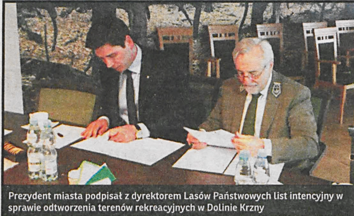
Prezydent miasta podpisał z dyrektorem Lasów Państwowych list intencji w sprawie odtworzenia terenów rekreacyjnych w Dolinie Krzny

W obszarze dawnych stawów hodowlanych nad Klukówką ma docelowo powstać tzw. Biosfera.