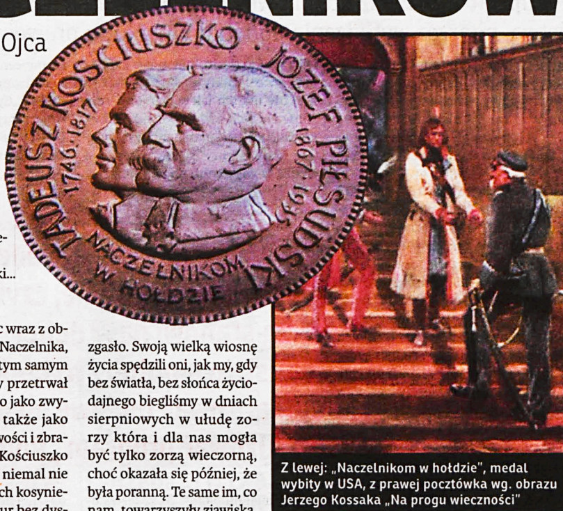
Z lewej: „Naczelnikom w hołdzie”, medal wybitny w USA, z prawej pocztówka wg. obrazu Jerzego Kossaka „Na progu wieczności”

Jeszcze w czasie trwania I wojny światowej Wieniawa – Długoszowski, ówczesny adiutant Piłsudskiego w rozmowie z nim wyraził zdziwienie, że zwalczają go różni patrioci, którym imię Kościuszki nie schodzi z ust, a przecież Komendant jest uosobieniem tradycji kościuszkowskich. Piłsudski profetycznie odpowiedział: „Rzecz tłumaczy się bardzo prosto. Powołać się na Kościuszkę, posługiwać się jego imieniem, zachwycać się nim i solidaryzować z jego ideami może każdy bezkarnie, bez konsekwencji i kosztów. Bo Kościuszko nie żyje. Kto solidaryzuje się z mną, musi płacić wyśiłkiem, męką, trudem, ofiarą wolności z życia. Kiedyś, gdy mnie już nie będzie, będę miał także miliony zapalczywych