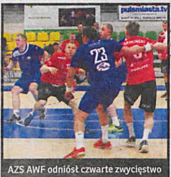
AZS AWF odniósł czwarte zwycięstwo