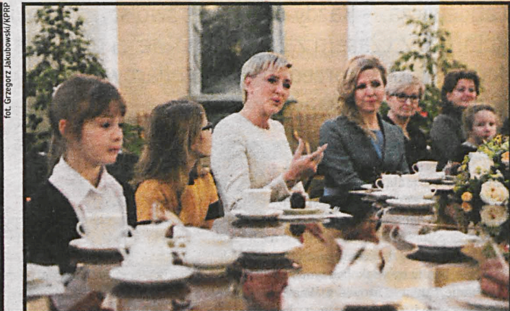
7 lutego liczną, międzypokoleniową reprezentacją białczan gościła w Pałacu Prezydenckim u Pierwszej Damy

oraz Stowarzyszenie Pomocy Młodzieży i Dzieciom Autystycznym oraz Młodzieży i Dzieciom o Pokrewnych Zaburzeniach „Wspólny Świat”.