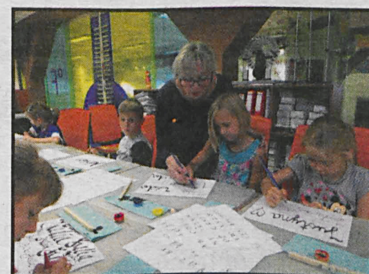
Lato w mieście nie musiało być nudne

W czasie wakacji Multicentrum zorganizowało dla najmłodszych zajęcia ze sztuki pięknego pisania. W warsztatach kaligrafii wzięły udział dzieci w wieku 7-12 lat. Zajęcia pozwoliły poznać najmłodszym zagadnienia sztuki literackiej i rozpocząć swoją przygodę z pięknym pisaniem. W pierwszej części warsztatów uczestnicy pracując przy komputerach i korzystając ze strony Biblioteki Narodowej, tworzyli wizytówki swoich imion na bazie zdigitalizowanych dokumentów, w ten sposób poznając historię literatury w Polsce. W drugiej części zajęć