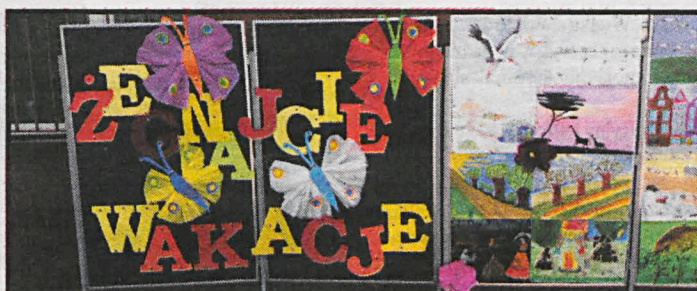
Przyjaznych szkół życzymy wszystkim, którzy 3 września rozpoczną nową przygodę

– Mieszkałem w bloku, na osiedlu miałem wielu rówieśników, kolegów do zabaw i gry w piłkę. Nasi rodzice też