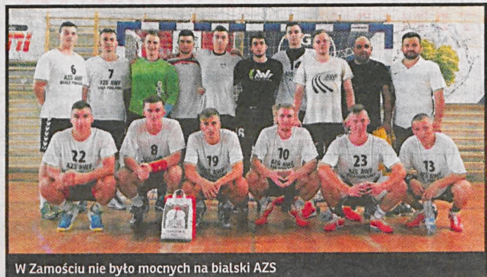
W Zamościu nie było mocnych na biały AZS

Rywalami akademików były ekipy miejscowej Padwy i KSZO Ostrowiec Świętokrzyski. W nadchodzący weekend białczanie udadzą się do Końskich, zagrają tam w turnieju towarzyskim, a ich rywalami będą poza miejscowym KSSPR, Uniwersytet Radom i Pabiks Pabianice.