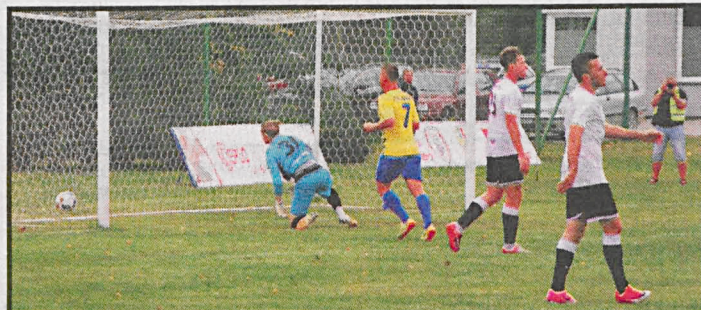
Podlasie nie sprostało rywalom ani w sobotę, ani w środę

Podlasie uległo w sobotę w Piszczacu Stali Kraśnik 0:3. Białczanie na cztery mecze z beniaminkami przegrali trzy i to martwi. Nie dali także rady sprawić niespodzianki i wydrzeć chociaż punktu Motorowi na jego terenie, ulegając lublinianom 1:3. W sobotę o godz. 16 na PSW Arenie Podlasie zmierzy się z KSZO Ostrowiec Świętokrzyski.