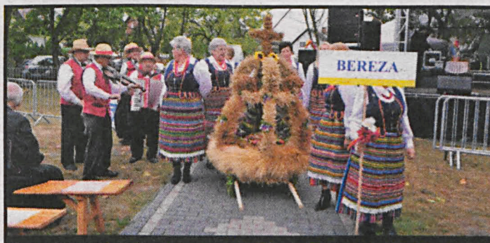
Prezentacja wienców i konkurs na najpiękniejszy – to żelazne punkty Dożynek

W niedzielę 2 września mszą św. o godz. 11 w kościele pw. Niepokalanego Poczęcia NMP w Drelowie rozpoczyna się XX Dożynki Powiatu Białskiego. W programie m.in. konkursy: „Wieniec Dożynkowy”, „Piękne, bo Białskie”, „Nasz chleb najlepszy”, „Najlepsze stoisko promocyjne”, degustacja potraw regionalnych, koncerty, występ kabaretu „Czwarta Fala”, Wieczór zakończy zespół Extaza – gwiazda wieczoru, pokaz ogni sztucznych i zabawa taneczna z zespołem Fortex.