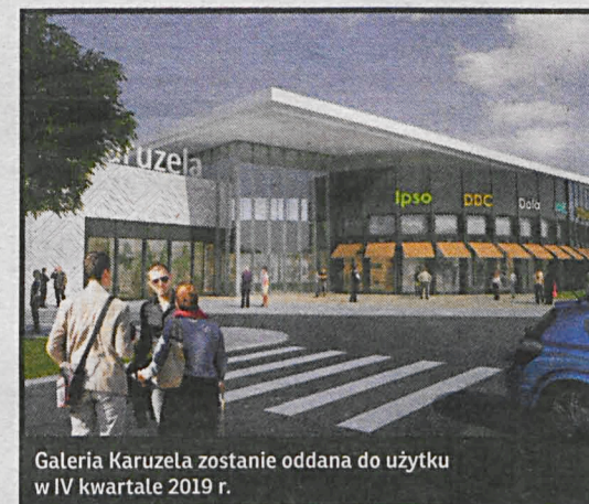
Galeria Karuzela zostanie oddana do użytku w IV kwartale 2019 r.

Karuzela Holding podpisał umowę z firmą Unibep z Bielska Podlaskiego na wykonawstwo kolejnego białskiego obiektu handlowego. Na terenach, gdzie niegdyś mieściła się fabryka mebli powstanie Galeria Karuzela. W pierwszym etapie prac wybudowane zostaną dwa budynki, w których na 20 tys. m 2 powierzchni znajdzie się ponad 60 sklepów, restauracje i strefa wypoczynku. Znajdzie tu zatrudnienie blisko pół tysiąca osób. Jednopoziomowy obiekt zostanie oddany do użytku w IV kwartale przyszłego roku. Galeria będzie doskonale zlokalizowana: 750 m od dworca kolejowego i w pobliżu trzech przystanków autobusowych. Mimo tego powstanie przed nią parking naziemny, który pomieści ok. tysiąca samochodów. Przy wejściach do galerii znajdzie się także 100 miejsc rowerowych oraz samoobsługowy punkt serwisowy dla rowerzystów. Koszt pierwszego etapu inwestycji to