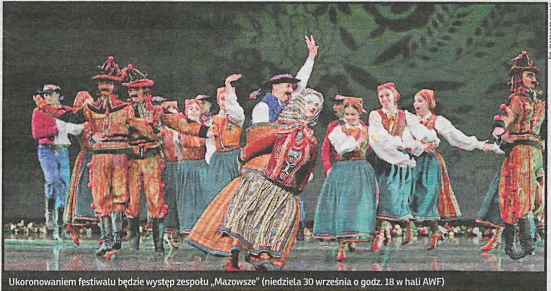
Ukoronowaniem festiwalu będzie występ zespołu „Mazowsze” (niedziela 30 września o godz. 18 w hali AWF)

W czwartek – prawdziwa gratka dla miłośników jazz i bluesa. Wystąpi zespół Jazz Trio, którego koncert będzie również lekcją patriotyzmu dla młodzieży. W kolejnych dniach – m.in. koncert chórów kościelnych i Jarmark Michałowy. Na zakończenie festiwalu, 30