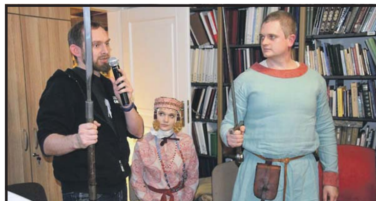
Rocznicowemu spotkaniu towarzyszyła wystawa posiadanych przez grupę zbroi, oręża, ubiorów, naczyń i narzędzi