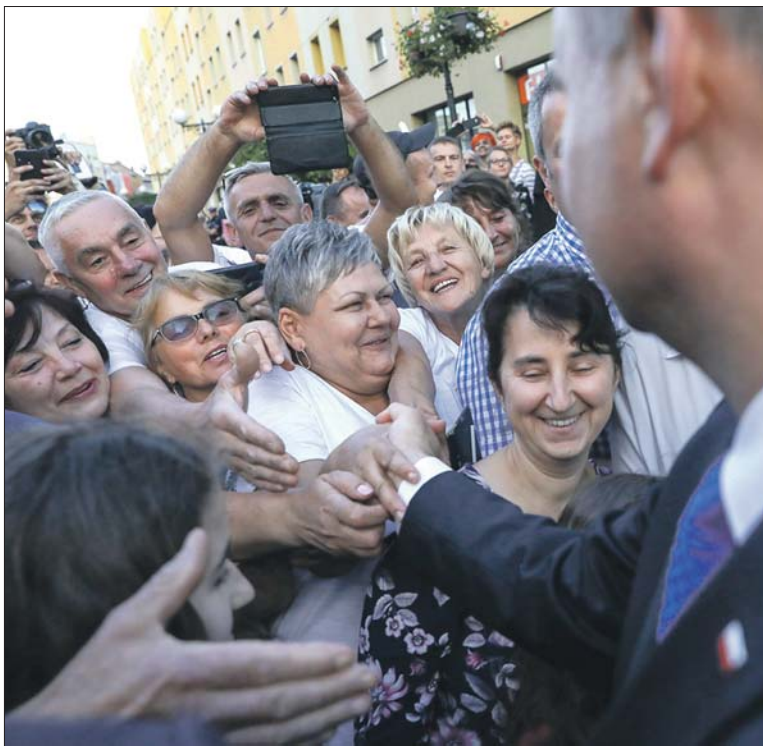
Jaki jest wyborca PiS? Rządząca Polską przez lata elity wciąż nie potrafią odpowiedzieć na to pytanie

„Nie wolno tak mówić” – twierdzi w przeprowadzonej przez Annę Ma-