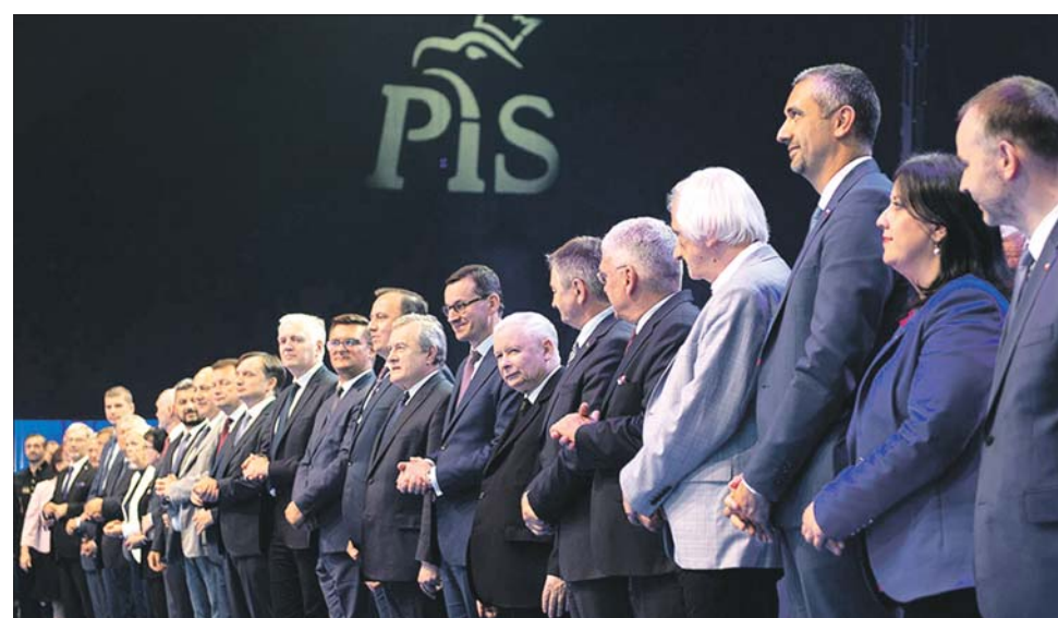
Aż 10 tysięcy osób uczestniczyło w dyskusjach o tym, co trzeba jeszcze w Polsce naprawić

– Nasz program realizacji marzeń Polaków, wsparcia dla rodziny spotyka się z wielką akceptacją. Możemy realizować te zobowiązania dzięki sprawności funkcjonowania państwa. Nasza wspólna praca ma służyć obronie polskich rodzin i polskich wartości. Musimy być nowoczesni, ale szanować polskie tradycje – powiedział Zbigniew Ziobro. Przewodniczący Porozumienia Jarosław Gowin przypomniał z kolei, że przez 4 lata rządów Zjednoczonej Prawicy, miliony polskich rodzin odzys-