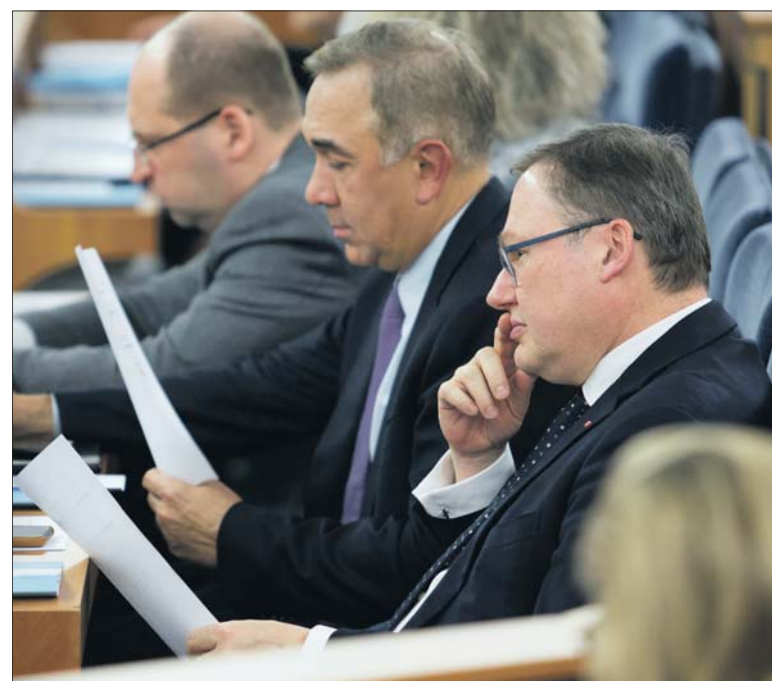
Senator Grzegorz Bierecki, przewodniczący senackiej komisji budżetu i finansów publicznych