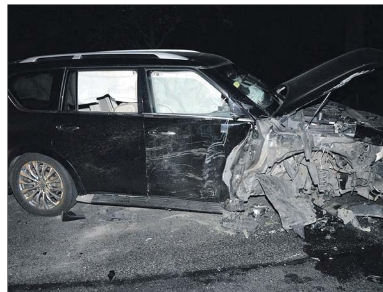
Takie szkody spowodowała jazda po pijanemu. W wypadku zostały ranne dwie osoby