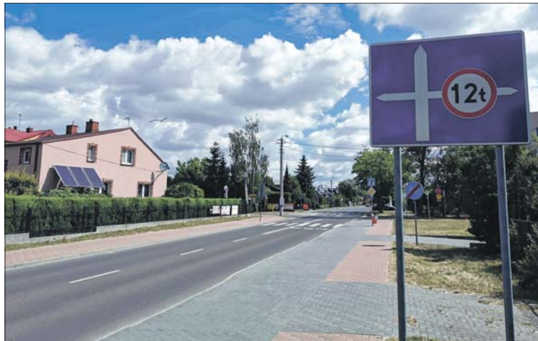
Wielu kierowców wciąż nie stosuje się niestety do zakazu

Zmiana organizacji ruchu została wprowadzona również na połączonej z ul. Kościuszki ul. Konstytucji 3 Maja oraz ul. Bohaterów i części Targowej. Znaki zakazu wjazdu na ul. Kościuszki stoją na ul. Międzyrzeckiej i Partyzantów – przy skrzyżowaniu z ul. Jana Pawła II, Międzyrzecką i Kościuszki. Jak informują władze Radzyna, projekt organizacji ruchu został zatwierdzony przez Zarząd Dróg Powiatowych Wydział Komunikacji Starostwa Powiatowego, poinformowana jest o tym Policja. Na razie nie wszyscy kierowcy przestrzegają zakazu – warto więc przypomnieć, że jego łamanie grozi mandatem w wysokości nawet 500 zł. Urzędnicy podkreślają, że do zakładu drGerard ciężarówki mogą dojechać ul.