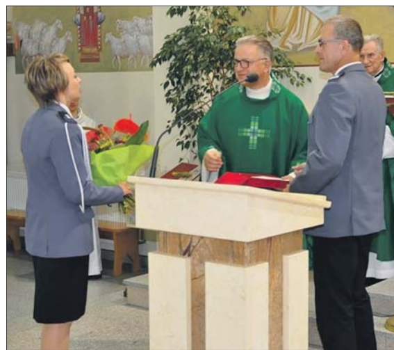
Policjanci, ich bliscy i mieszkańcy regionu modlili się w intencji bezpiecznej służby