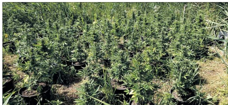
Krzaki konopi indyjskich rosły w trudno dostępnym miejscu

Policjanci Wydziału Kryminalnego Komisarjatu Policji w Terespolu odkryli konopie, które rosły w doniczkach na dwóch ogrodzonych działkach, na terenie nieużytków rolnych. Miejsce ich wysadzenia było dokładnie przygotowane, a uprawa pielęgnowana przez „ogrodnika”, który został przyłapany przez mundurowych na gorącym uczynku. Rokitno. W trakcie wykonywanych w sprawie czynności, w miejscu jego zamieszkania, policjanci ujawnili kilkadziesiąt gram suszu. Po wstępnym badaniu potwierdzili, że jest to marihuana. Zabezpieczona ilość wystarczyłaby do sporządzenia niemal 350 porcji dealerskich tego narkotyku.