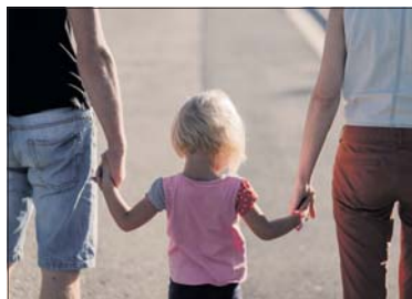
Warsztaty w Borkach mają pomóc rodzicom

Chcesz poprawić relacje ze swoimi dziećmi? Skorzystaj z programu gminy Borki, która proponuje szkolenia z prawidłowego komunikowania się z najmłodszymi. „Akademia dobrego rodzica” to cykl bezpłatnych warsztatów poszerzania kompetencji wychowawczych. Cotygodniowe warsztaty będą prowadzone do września. Drugie spotkanie cyklu odbędzie się w najbliższy poniedziałek (15 lipca) o godz. 11. Swoją udział można zgłaszać telefonicz-