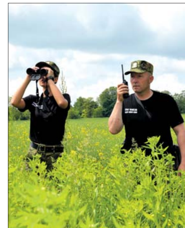
Praca w Straży Granicznej to ciekawe wyzwanie

Dokumenty od kandydatów przyjmowane będą po wcześniejszym wyznaczeniu terminu do ich złożenia. Zapisy kandydatów zainteresowanych złożeniem dokumentów odbywać się będą od poniedziałku do piątku w godz. 8.00-15.00 pod nr tel. 82-568 50 92 lub 797 337 619. Istnieje możliwość umówienia terminu złożenia wymaganych dokumentów za pośrednictwem poczty elektronicznej (w treści e-maila należy podać imię i nazwisko tylko jednego kandydata): nabor.nadbuzanski@strazgraniczna.pl. Wyznaczenie terminu