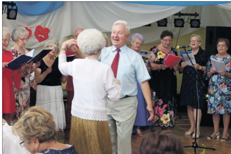
Seniorzy ze Stowarzyszenia Radzyńskie Wrzószy są pełni energii

Członkowie Stowarzyszenia Radzyńskie Wrzószy zorganizowali spotkanie integracyjne. To była świetna okazja, by przedstawić dorobek tej znakomitej organizacji seniorskiej.