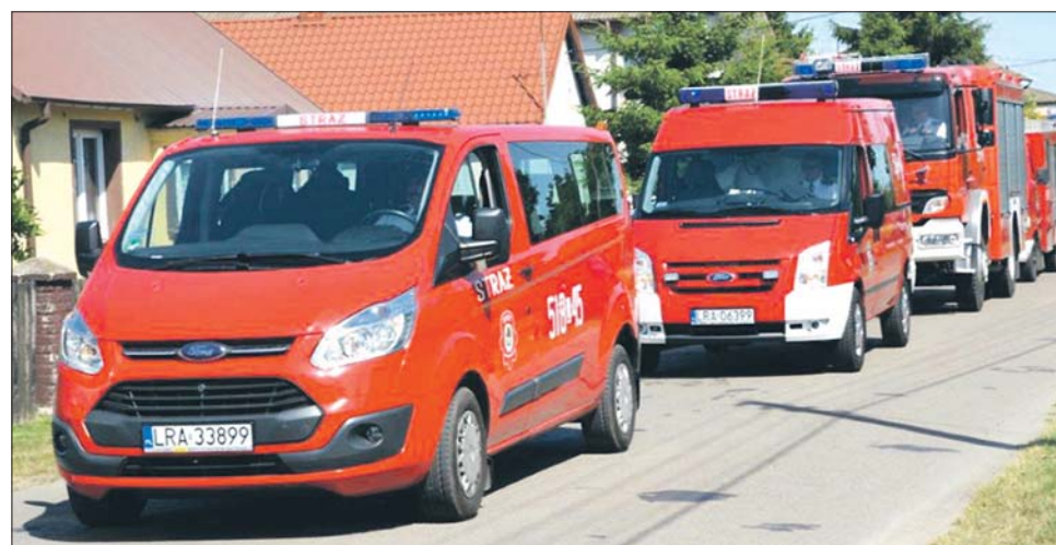
Rząd Prawa i Sprawiedliwości wspiera strażaków-ochotników

– Ochotnicze Straże Pożarne od wielu lat walczą z pożarami i pomagają ofiarom wypadków drogowych. Jednak oprócz tego wykonują też inne działania, które w wymiarze publicznym pozostają związane z szeroko pojętą ochroną i profilaktyką społeczną. Dlatego właśnie rząd, doceniając dotychczasową działalność OSP, zdecydował, że zadania realizowane przez ochotnicze straże uzyskają rangę ustawową – pozwoli to m.in. na rozszerzenie źródeł finansowania – czytamy w komunikacie Ministerstwa Spraw Wewnętrznych i Administracji.