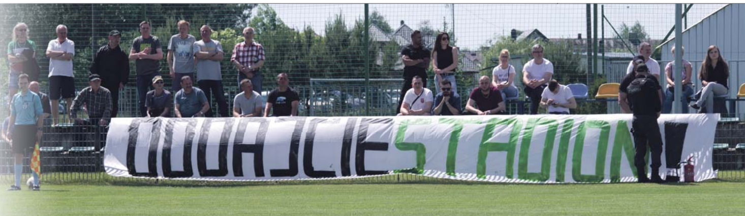
Protest środowisk, którym zależy na rozwoju bialskiego sportu przyniósł skutek. Teraz trzeba pilnować realizacji obietnic złożonych przez Litwiniuka

Mimo niewątpliwego sukcesu środowiska piłkarskiego i bialskiej opozycji (mówiło się wszak, że