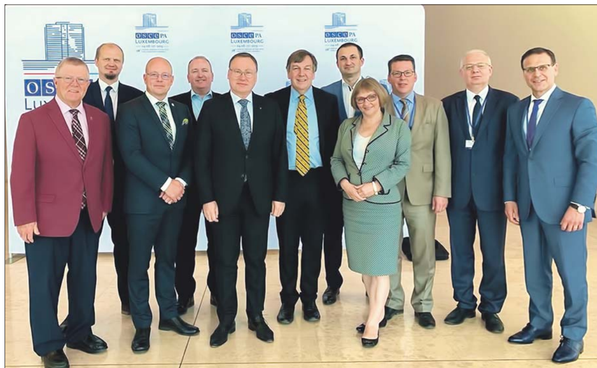
Senator Grzegorz Bierecki w otoczeniu konserwatywnych parlamentarzystów, którym będzie przewodził

– OBWE to organizacja o niesłabnącym od wielu lat znaczeniu, a w obliczu niepokojów i rosnących w Europie zagrożeń – tak wewnętrznych, jak też zewnętrznych – mocny głos w Organizacji jest ważny dla Polski i jej funda-