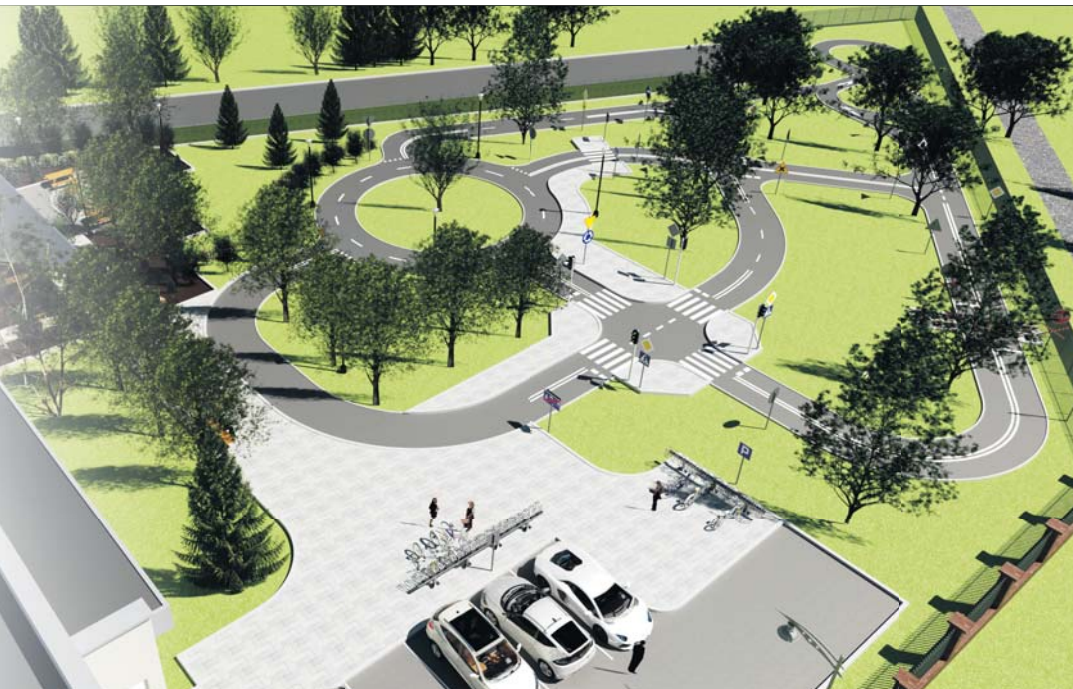
Układ miasteczka ma umożliwić odzwierciedlenie rzeczywistego ruchu ulicznego