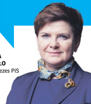
BEATA SZYDŁO Wiceprezes PIS

Są tacy politycy, którzy uważają, że polityka to taka letnia kanikuła. Jakiś żarcik, prowokacja, byle pijar i się kręci. Tak nie jest. Polityka polega na czymś innym. To jest ciężka, uczciwa praca.