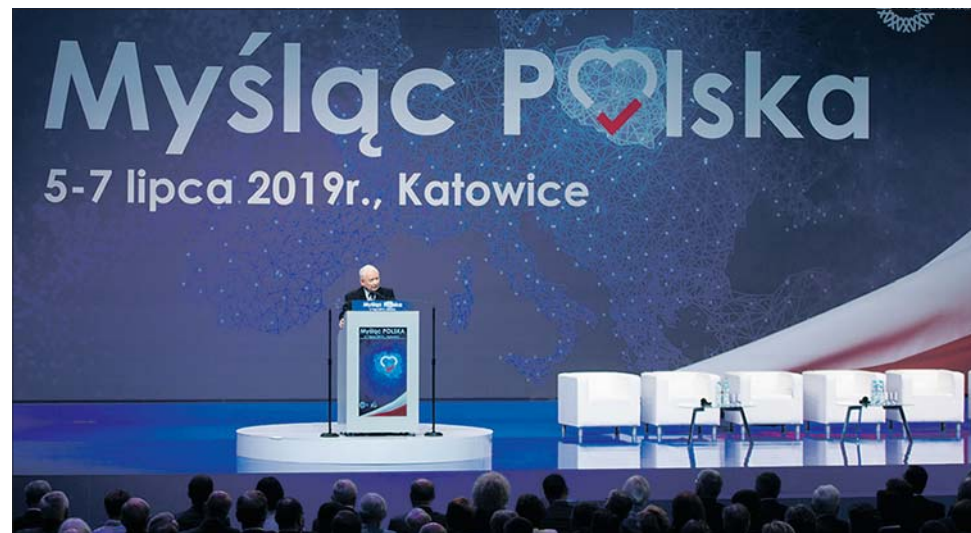
Konwencja PiS w Katowicach stała pod znakiem rozmów o programie. Ma być on przedstawiony Polakom już niebawem

W trakcie konwencji wystąpił także Zbigniew Ziobro, lider wchodzący w skład Zjednoczonej Prawicy Solidarnej Polski. Podkreślał on, iż „dobra zmiana” to nie tylko nazwa, ale przede wszystkim rzeczywiste działania.