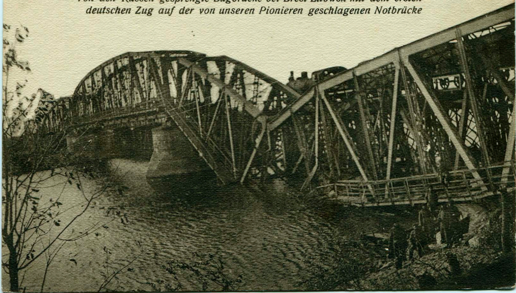
Von den Russen gesprengte Bugbrücke bei Brest-Litowsk mit dem ersten deutschen Zug auf der von unseren Pionieren geschlagenen Notbrücke