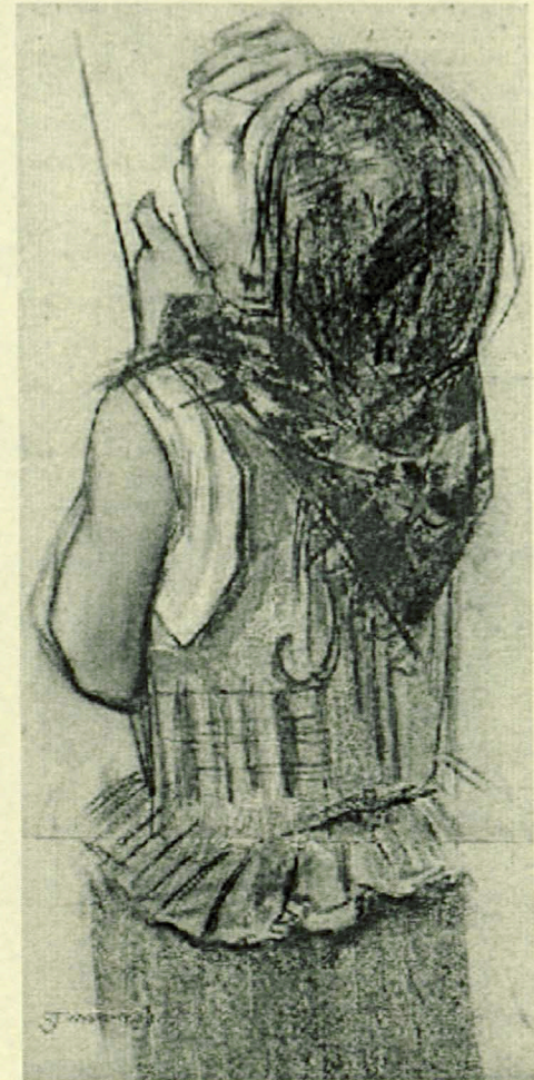
Wystawa MBPF2 ul. Warszawska 11 15-31 maj 2007r.