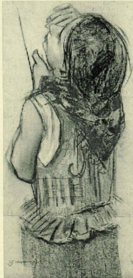
Wystawa MBPF2 ul. Warszawska 11 15-31 maj 2007r.