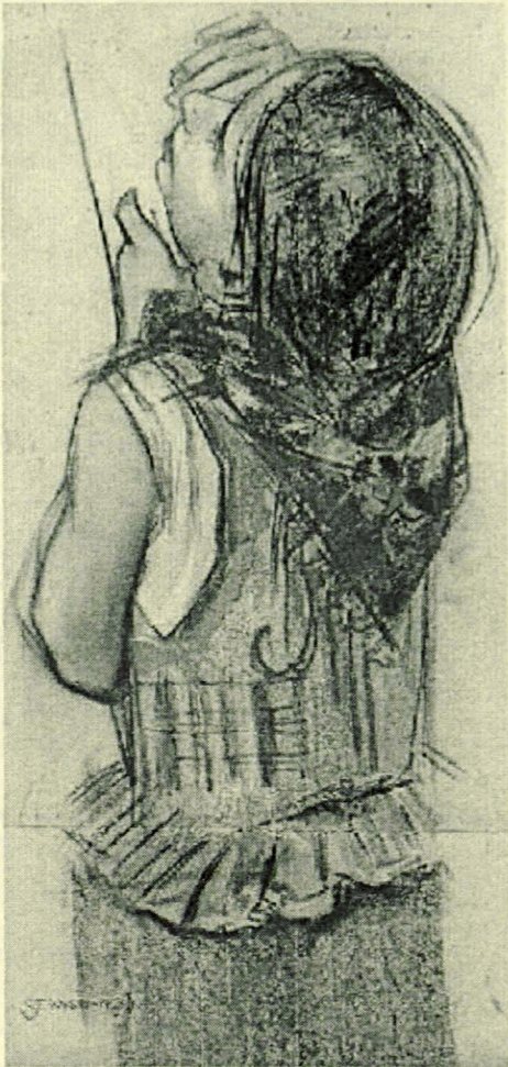
Wystawa MBPF2 ul. Warszawska 11 15-31 maj 2007r.